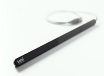
Figure 4: Oculomètre de type "barre" pour l'analyse sur écran.