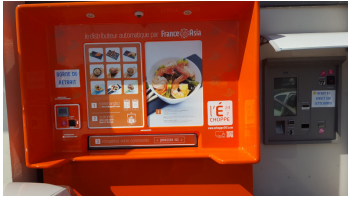
Figure 1: Borne tactile de commande (à droite) et automate de livraison de plats préparés (en orange, à gauche).