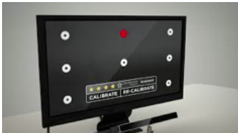
Figure 3: Phase de calibration de l'oculomètre.