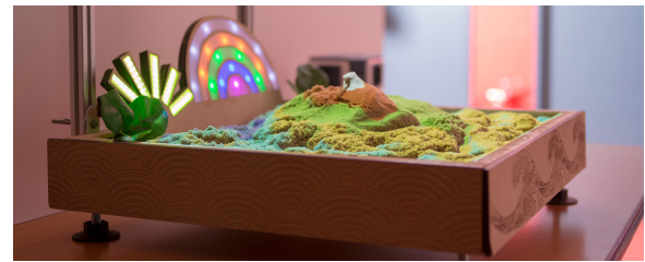
FIGURE 1: Inner Garden est un bac à sable interactif permettant de projeter les états internes de l'utilisateur.rice.

Permission to make digital or hard copies of all or part of this work for personal or classroom use is granted without fee provided that copies are not made or distributed for profit or commercial advantage and that copies bear this notice and the full citation on the first page. Copyrights for components of this work owned by others than the author(s) must be honored. Abstracting with credit is permitted. To copy otherwise, or republish, to post on servers or to redistribute to lists, requires prior specific permission and/or a fee. Request permissions from permissions@acm.org .