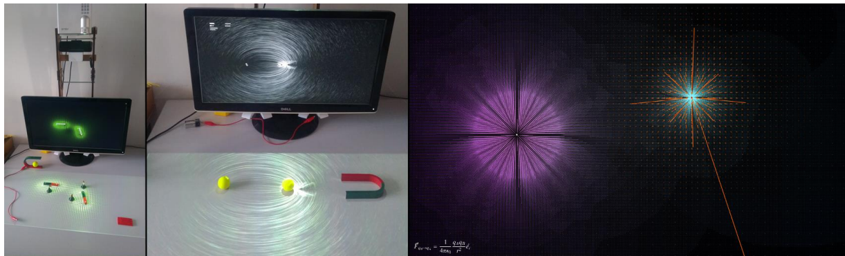
Figure 1: Illustration de DEAPE learn - Etude du changement conceptuel en physique sur les concepts de champ

Julien Da Costa TECFA/Université de Genève Pignon 40, bd. du Pont d'Arve, 1205 Genève, Suisse julien.dacosta@unige.ch