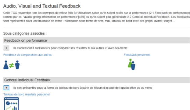
Figure 2. Ecran secondaire

Dans cet écran (figure 2), la TCC principale de la catégorie est définie, ses sous-catégories sont présentées ainsi que leurs différentes mises en forme possibles. Chaque sous-catégorie peut être utilisée de différentes manières (ex. dans le sous-critère « Feedback on performance », la performance peut renvoyer au groupe d'appartenance ou à soi-même).