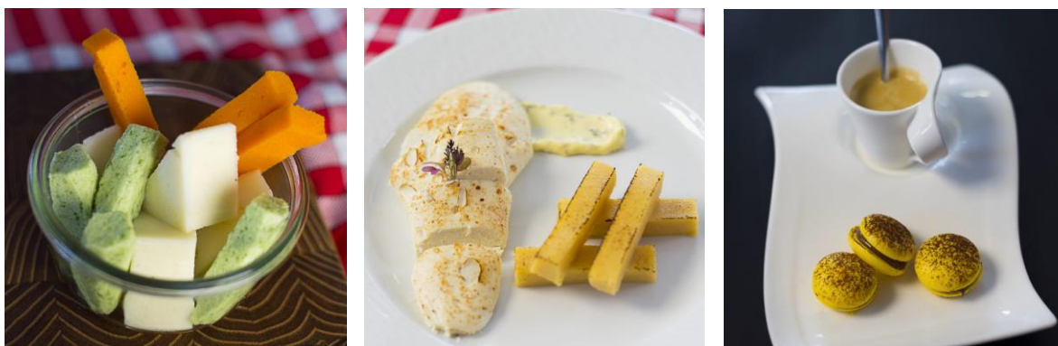
Figure 2 : Exemple de plats mixés remis en forme grâce aux techniques de la gastronomie moléculaire.

Ces dernières années, d'importants progrès ont été faits pour améliorer l'aspect des aliments mixés, en utilisant notamment des techniques de la gastronomie moléculaire. De nombreuses sociétés ont éclo sur le marché pour proposer des agents texturants ( e.g. agar agar, carraghénane) ou des moules pour « redonner de la forme » aux purées (Figure 2).