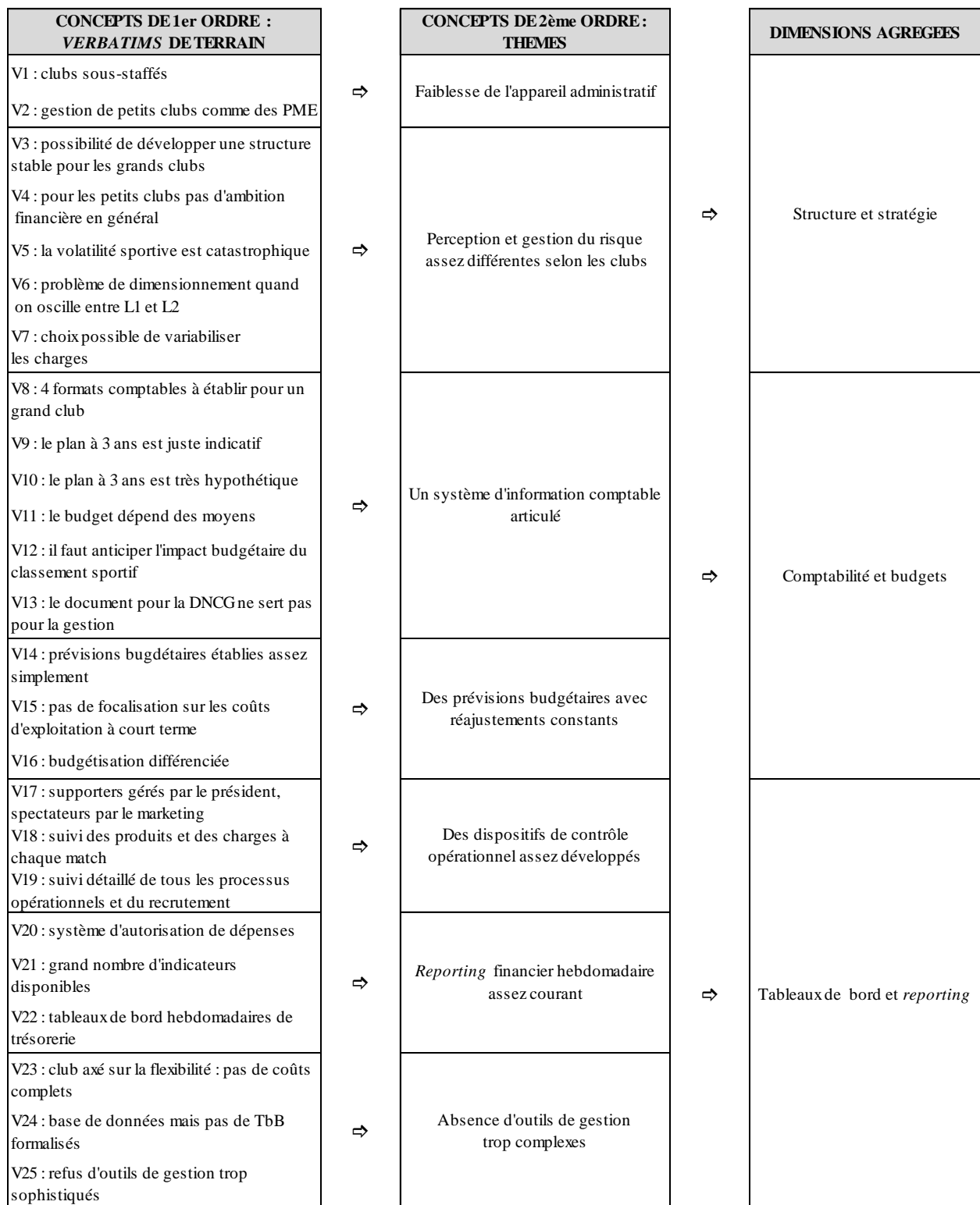
Schéma 2 : Structuration des verbatim recueillis.