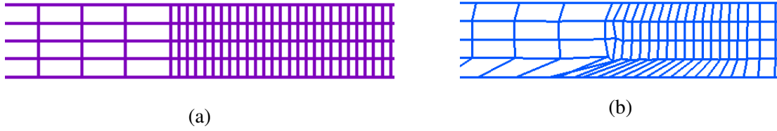
FIGURE 1 – Maillages avec zoom sur la discontinuité de contact et sur le choc dans le cas test de Sod en géométrie axisymétrique : (a) masses nodales variables (2) et (b) masse nodale constante « Wilkins ».