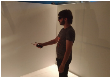
Figure 2: plateforme expérimentale utilisée (haut) un utilisateur immergé dans l'EV à travers un casque de réalité virtuelle (bas) un utilisateur immergé dans l'EV à travers un cube immersif.

virtuelle immersive et la réduction de leur coût offrent des possibilités nouvelles pour inclure des avatars avec des niveaux de fidélité plus adaptés. Notre objectif est d'explorer ces approches d'une manière systématique.