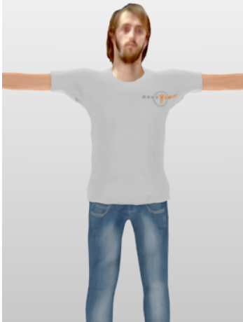
Figure 1: Les deux types d'avatars comparés : (haut) avatar en nuage de points (bas) avatar préconstruit

avec des résultats suggérant une forte corrélation entre le sentiment de présence et le degré d'association de l'utilisateur avec son corps virtuel (sens d'incarnation) [9]. Dans les EVC, la perception du corps du partenaire est encore plus importante, car elle donne des informations cruciales sur l'activité des partenaires telles que leur position, identité, objets d'intérêt, gestes, et actions [16].