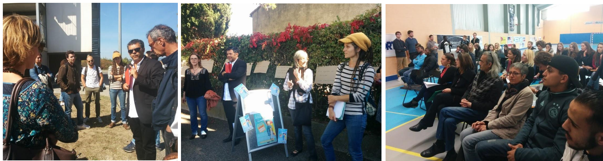
workshop Carcassonne Fleming, 2017

Atelier de réflexion Ville Partagée LRA , 17 octobre 2018