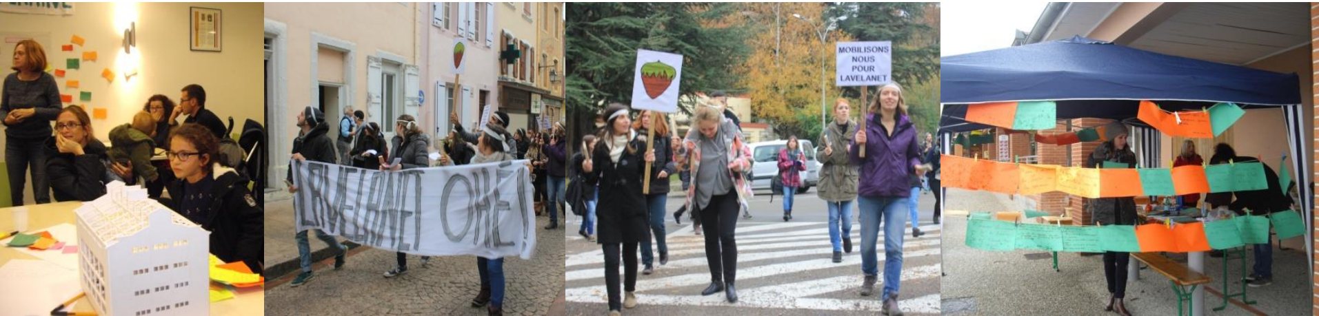
workshop Lavelanet, 2014 + SICOVAL 2015

Atelier de réflexion Ville Partagée LRA , 17 octobre 2018