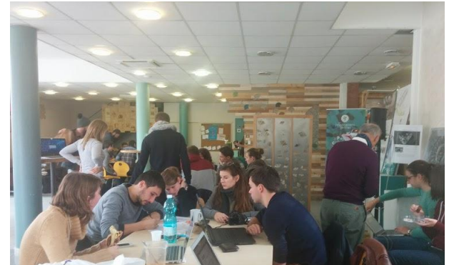
workshop Toulouse Arènes, 2016