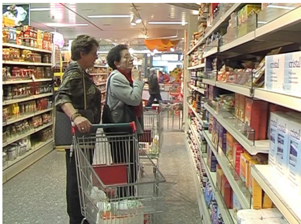
Figure 4. Corpus De Stefani : les interactions au supermarché

En étudiant les ressources multimodales, verbales et « non verbales », Elwys De Stefani rend compte d'une pluralité d'actions accomplies par les participants. Par exemple, le fait qu'A soulève une valise d'une certaine manière déclenche un commentaire de B qui ne dit rien à propos de l' achetabilité du produit ( witnessing object manipulation ). Cet exemple illustre l'engagement des deux participants dans une activité collective : ils sont engagés dans une activité commune. En revanche, le fait de montrer un produit sans y référer verbalement, par exemple des cuisses de poulet, est interprété comme une proposition d'achat. Et, en tant que telle, cette action gestuelle est refusée par le co-participant ( no no le cosce di pollo no , « non non les cuisses de poulet non »). L'énonciation d'un simple référent lexical ( pasta della pizza , « pâte à pizza ») implique une sollicitation de réorientation vers une zone spécifique (le rayon frigo) et la production d'un directif ( prendila , « prends-la ») à l'adresse de son partenaire. La mobilisation de ressources verbales, comme un syntagme nominal pour désigner un produit spécifique, peut être interprétée différemment : dans certains cas, cette ressource peut signaler un objet comme potentiellement « achetable » ; dans d'autres, elle peut constituer un objet comme « non achetable ».