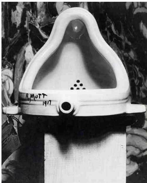
Figure 2. Fontaine – Marcel Duchamp, 1917

Toujours plongés dans l'espace où ils sont situés, les objets, en tant que cristallisations de propriétés instructionnelles ( instructional properties ), font l'objet d'une des dernières contributions de Garfinkel (2002 : 213 ss.). En particulier, le sociologue nord-américain se penche sur l'examen de la cuisine d'une femme aveugle, Helen, qui présente une disposition très précise des ustensiles de cuisine, dont l'information instructionnelle est véhiculée par leur disposition, mutuelle et relative aux électro-ménagers. Ainsi, les objets acquièrent leur fonction et peuvent être considérés comme de véritables ressources, d'une part, dans leur possibilité d'usage pour une finalité pratique (cuisiner, préparer le café, etc.) et, d'autre part, par le biais de leur arrangement dans l'espace parmi d'autres objets (prendre la casserole, c'est ne pas prendre la poêle juste à côté).