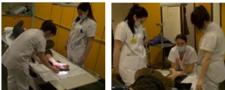
Figures 7a et 7b. Corpus Filliettaz : la manipulation de la cheville

l'apprentie ( Response ) et, suite à la notification d'une erreur par l'experte ( Evaluation ), l'étudiante produit une reformulation réactive. L'expérience multimodale procède donc par « superposition » : différentes zones/composantes de la cheville sont manipulées au cours de l'interaction. Dans ce premier extrait, la partie du corps sert de support d'une activité épistémique et le statut de l'objet (partie du corps) est modifié au cours de l'activité. La cheville n'est plus seulement une partie du corps à réparer, mais elle devient (i) un objet de connaissance à négocier dans un domaine et (ii) un lieu d'accès pour une compétence technique professionnelle à parfaire.