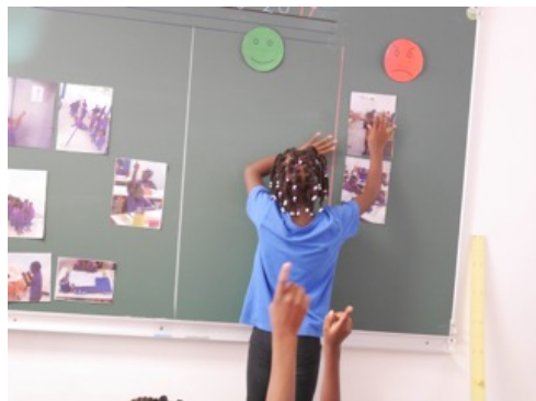
Figures 6a et 6b. Corpus Guyane : captation vidéo en classe