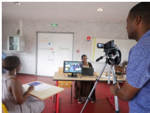
Figure 6c. Corpus Guyane : captation d'entretiens d'auto-confrontation avec les enseignants

Dans la phase d'analyse, plusieurs axes de recherche ont été mobilisés dans les domaines de la sociolinguistique et de la didactique : l'étude des spécificités de l'oral par rapport à l'écrit, la communication exolingue, la didactique du plurilinguisme, l'analyse des interactions et l'analyse multimodale. L'étude de ces éléments bénéficie des apports mutuels entre chercheurs et formateurs. L'objectif général du projet s'inscrit dans l'argumentaire de l'Ifé en tant que centre de recherche et de formation qui revendique la nécessité de « ramener le réel en formation » grâce à l'étude de situations ordinaires auxquelles les enseignants sont confrontés dans l'exercice de leur profession.