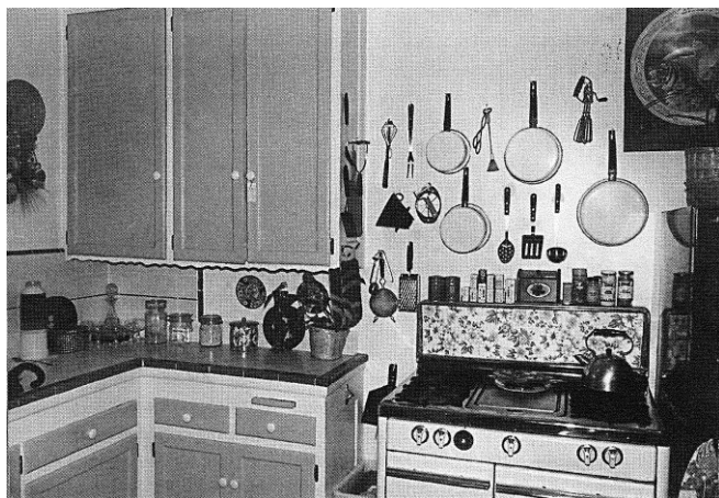
Figure 3. La cuisine de Helen (Garfinkel, 2002 : 213)

Toujours plongés dans l'espace où ils sont situés, les objets, en tant que cristallisations de propriétés instructionnelles ( instructional properties ), font l'objet d'une des dernières contributions de Garfinkel (2002 : 213 ss.). En particulier, le sociologue nord-américain se penche sur l'examen de la cuisine d'une femme aveugle, Helen, qui présente une disposition très précise des ustensiles de cuisine, dont l'information instructionnelle est véhiculée par leur disposition, mutuelle et relative aux électro-ménagers. Ainsi, les objets acquièrent leur fonction et peuvent être considérés comme de véritables ressources, d'une part, dans leur possibilité d'usage pour une finalité pratique (cuisiner, préparer le café, etc.) et, d'autre part, par le biais de leur arrangement dans l'espace parmi d'autres objets (prendre la casserole, c'est ne pas prendre la poêle juste à côté).