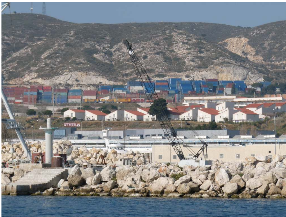
Figure 6. Stockage de conteneurs entre Mourepiane et l'Estaque, Marseille / Containers storage between Mourepiane and Estaque, Marseilles.