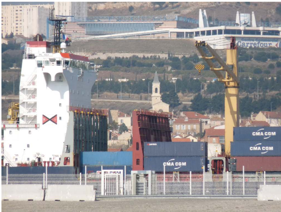
Figure 3. Saint-Henri (15 e ) depuis la mer : infrastructure portuaire, noyau villageois, centre commercial, grands ensembles / Saint-Henri (15 th ) seen from the sea : port infrastructures, urban « village » core, mall, large housings.

connotations négatives. Les investissements privés y sont d'ailleurs moins développés que sur le reste de la commune, même si de nouvelles constructions avec vue sur les infrastructures portuaires, ou plus directement sur la mer ponctuent le tissu urbain.