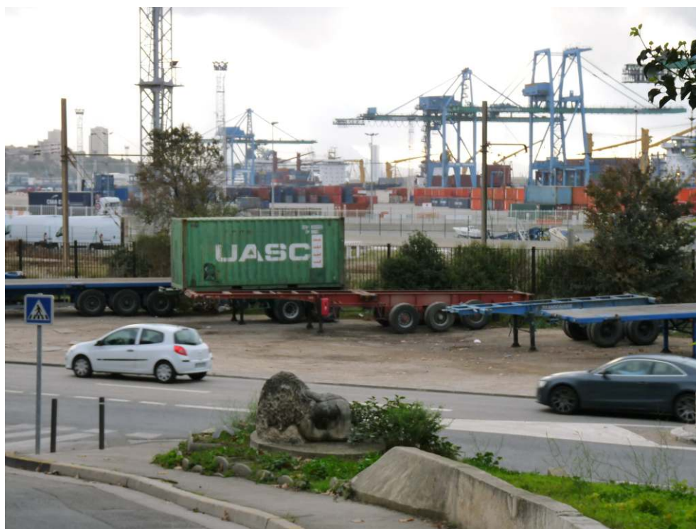
Figure 4. Insuffisance des aménagements piétons et prégnance de l'activité portuaire dans les espaces publics / Lack of pedestrian comfort and strength of port activities' traces on public spaces.

camions » à une « horreur quotidienne » (Tous ensemble contre le bruit, 2008). Plus de 60 transporteurs sont dénombrés par les associations à proximité du port tandis que les comptages effectués en 2008 font état d'un flux de 3 400 poids lourds par jour de semaine (hors vacances) entrant dans la ville au nord de l'interface ville-port, de 2 500 dans la portion intermédiaire de l'interface et 1 400 dans la partie sud, au centre de la ville (Agam, 2012, p. 5). L'axe longeant le littoral fait partie des « trois principaux corridors métropolitains » et relie Marseille aux communes de l'étang de Berre ainsi qu'aux bassins ouest de Fos-sur-Mer (Mission interministérielle pour le Projet métropolitain Aix-Marseille-Provence, 2014). La dangerosité du trafic est accentuée par l'aménagement insuffisant d'espaces publics réservés aux piétons. « On peut pas marcher ! On s'est déjà battu, parce que les gens qui veulent aller à l'Estaque à pieds, en poussette, il n'y a déjà pas les trottoirs entretenus comme il faut, on peut pas ! Il faut descendre, vous voyez un peu la route à 4 voies, quand vous descendez avec une poussette, avec tous les demeurés qui arrivent à 120 à l'heure, je vous raconte pas ! » (association D, 2/12/2011). L'intensité du trafic semble ainsi incompatible avec la structure urbaine des zones habitées traversées.