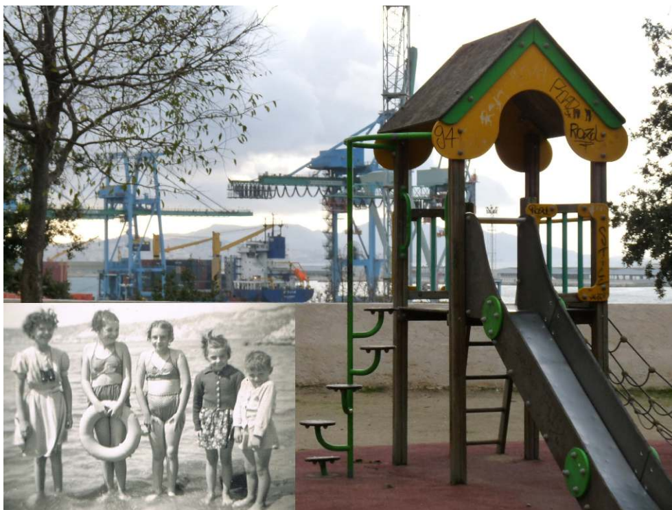
Figure 7. Perte de l'accès à la mer et transformation des pratiques, Mourepiane (16 e ) / Loss of access to the sea and practices change, Mourepiane (16 th ).