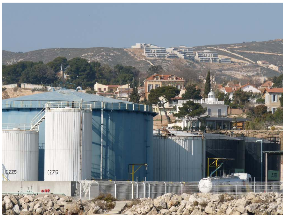
Figure 5. Proximité des installations industrialo-portuaires avec les habitations de Mourepiane (16 e ). Nouvelles constructions en hauteur pour une vue dégagée sur la mer / Port-industrial firms' proximity to Mourepiane's dwellings (16 th ). At height, new housings with an open view to the Mediterranean on work.