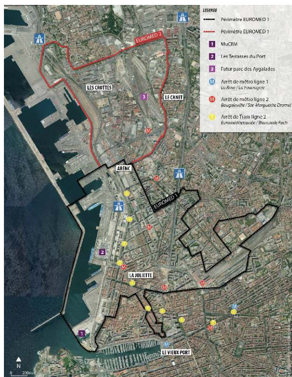
Figure 8. Périmètres de l'opération Euroméditerranée / Euroméditerranée National Interest Planning Project's perimeters.