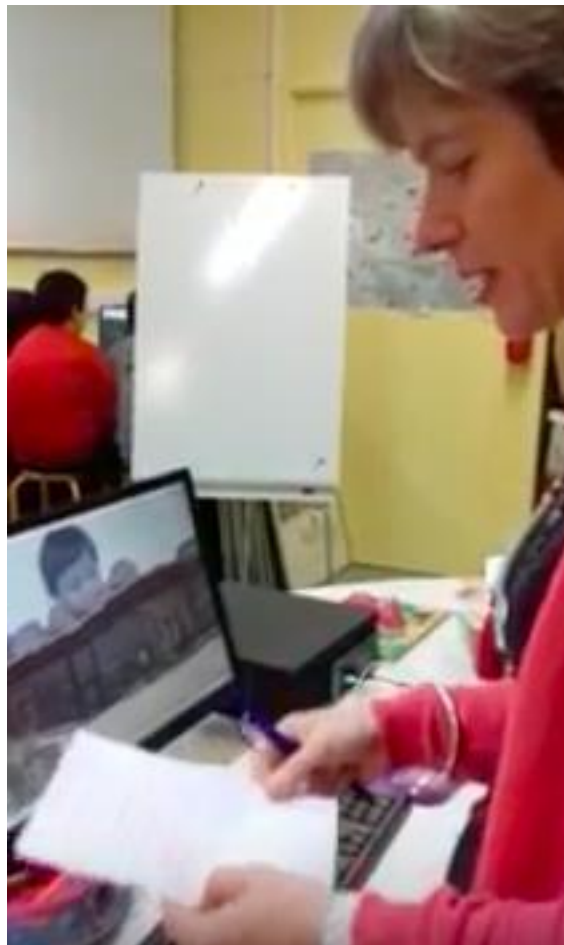
Séquence vidéo : Travail des élèves en classe avec la professeur documentaliste

Les enseignants partent des connaissances des élèves et apportent une aide à la mise en mots de leurs pratiques.