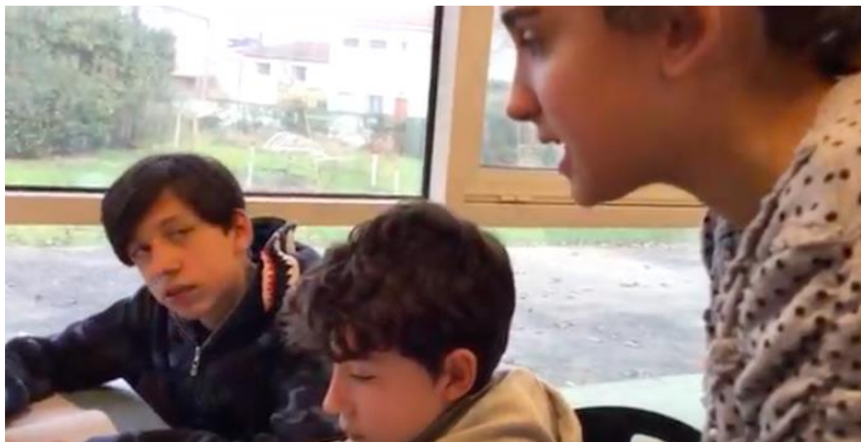
Séquence vidéo : Travail des élèves en groupe

Le travail a été mené par petits groupes au CDI des établissements et les élèves ont été laissés libres dans le choix des sujets et la façon de les présenter. Les élèves sont restés