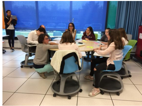
Illustration : Ateliers d'idéation en groupes