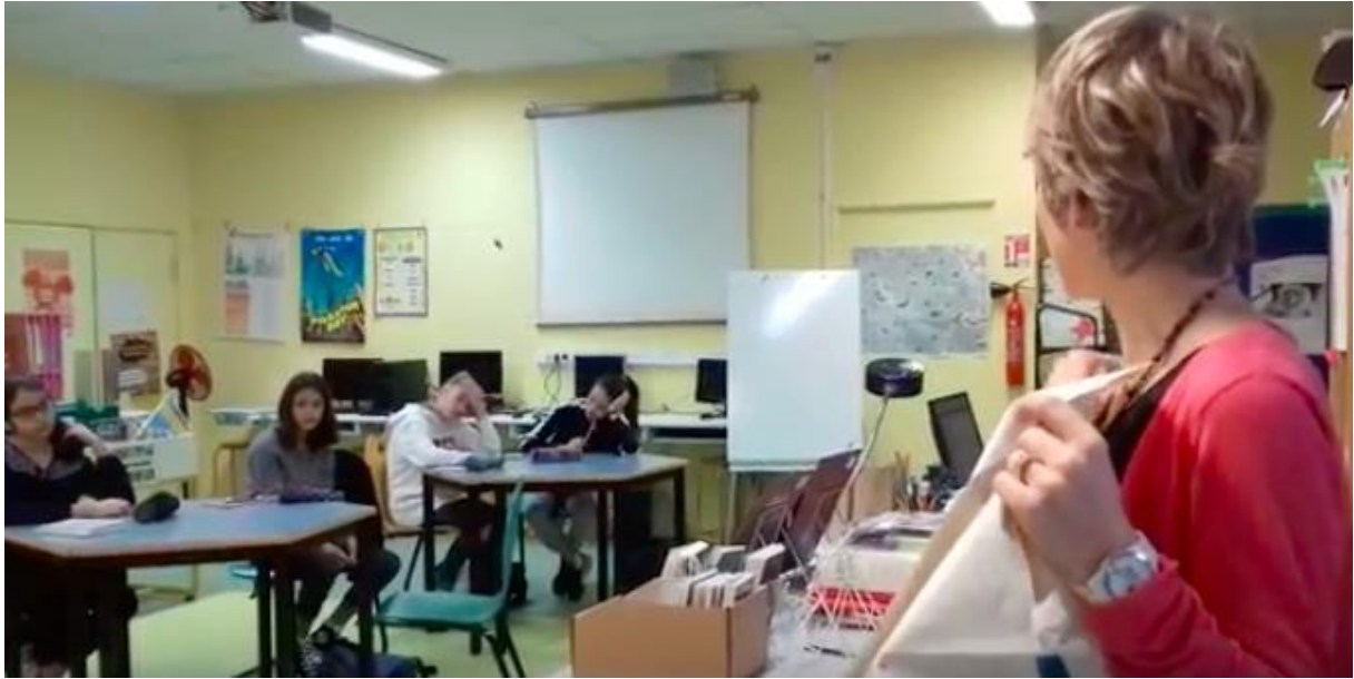
Séquence vidéo : Travail des élèves en classe avec la professeur documentaliste

motivés sur l'ensemble du projet et les enseignants ont été maîtres d'œuvre dans l'organisation du projet.