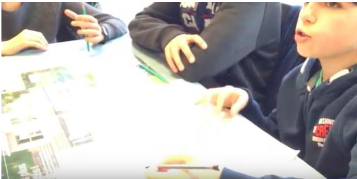
Séquence vidéo : Travail des élèves en groupe

Les élèves ont été guidés davantage sur la forme à donner à leur travail de présentation que sur les contenus à aborder. Les enseignantes ont parfois accompagné dans la formulation des messages que les élèves souhaitent transmettre, sans les influencer ou intervenir sur le sens recherché.