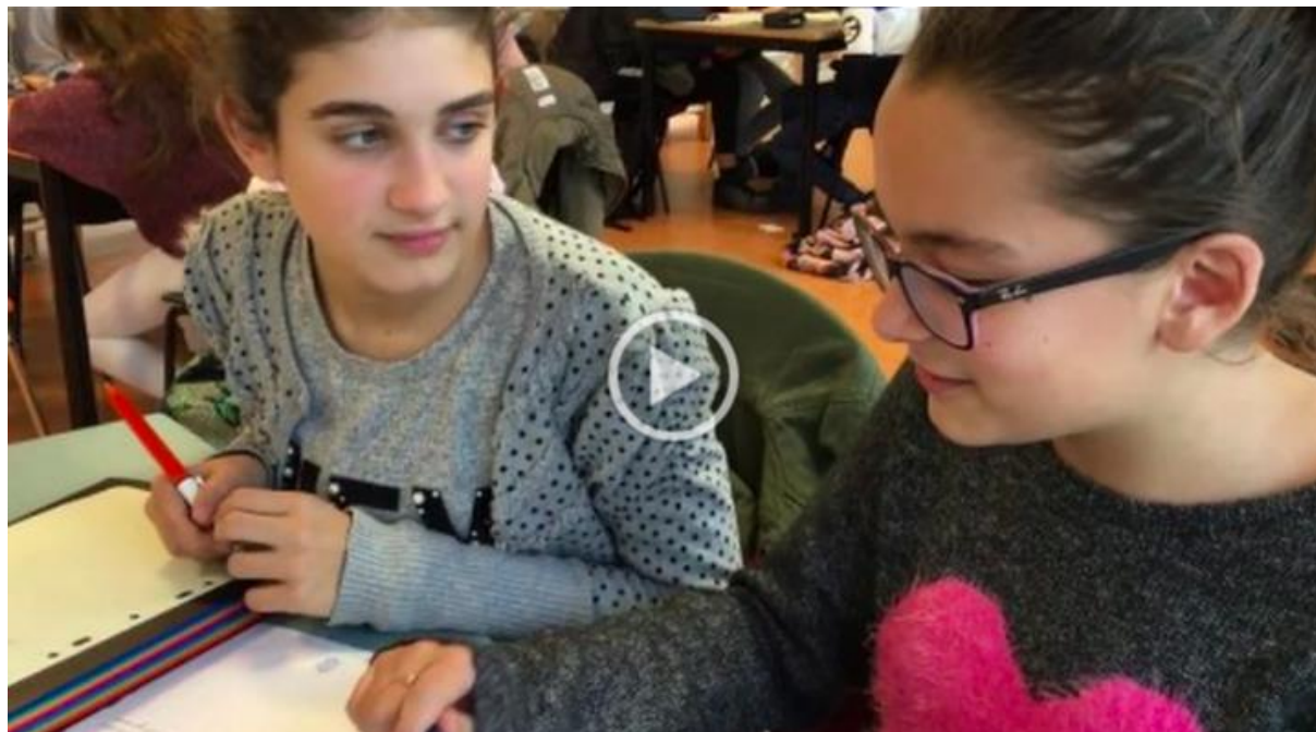
Séquence vidéo : Travail des élèves en groupe

Les élèves ont travaillé en équipes et ont développé des compétences propres à la communication et à la gestion de travail de groupe :