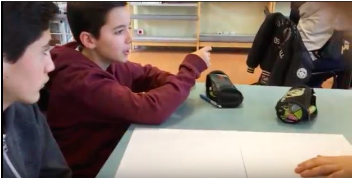
Séquence vidéo : Travail des élèves en groupe

Les enseignants partent des connaissances des élèves et apportent une aide à la mise en mots de leurs pratiques.