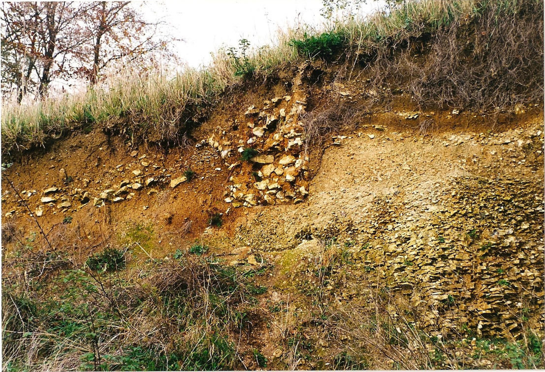
Fig. 1. Photographie d'un vestige de la muraille du parc du château d'Hesdin.