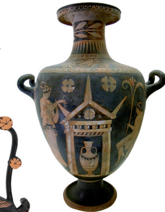
Offrandes à la tombe, hydrie, Peintre du Primato, conservé aux musées du Vatican (U 39).