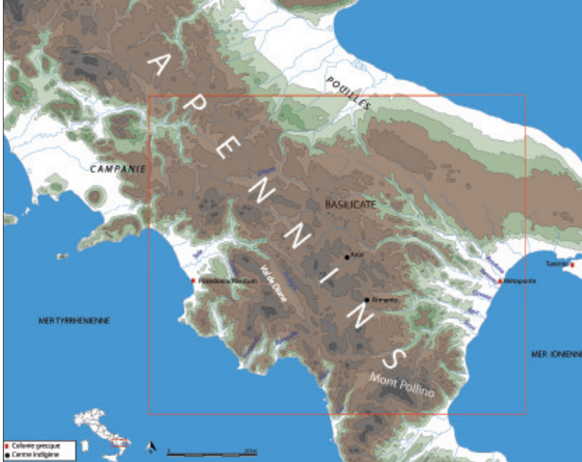
Carte géographique de la Lucanie antique. DAO A. Attia.

par les sites de distribution des vases. La notion d'atelier est donc plus anthropologique qu'archéologique, dans le sens où il s'agit d'une reconstruction intellectuelle à partir de groupes d'artisans anonymes identifiables par le choix des formes, des schémas décoratifs, des iconographies et du style employés.