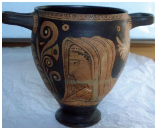
Tête de femme et oiseau, skyphos, Peintre du Primato, conservé au musée du Louvre (inv. K 558).

Néanmoins, il convient de souligner parfois un manque de réussite technique. Ces irrégularités sont de plusieurs natures et interviennent à toutes les étapes de la réalisation (mauvaise préparation de l'argile occasionnant boursouflures et éclatements à la cuisson, application hétérogène du vernis, manque