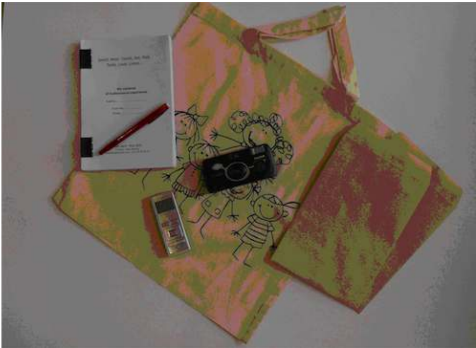
Figure 5. Baluchon multisensoriel