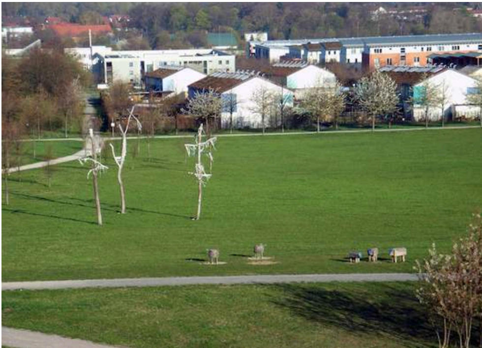
Figure 3. Le parc paysager de Kronsberg