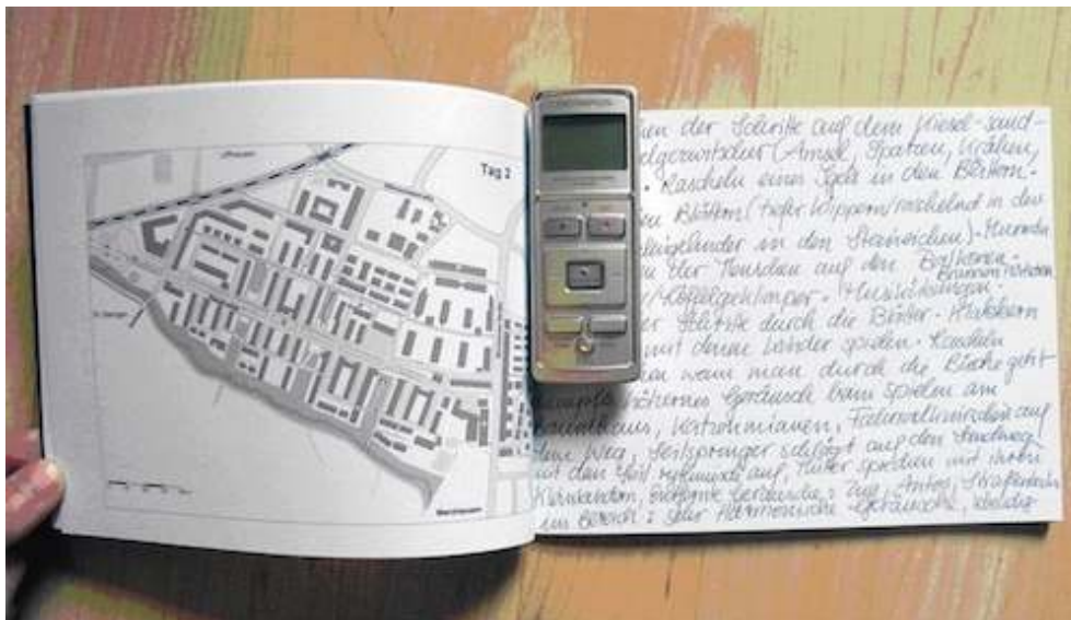
Figure 4. Journal sonore