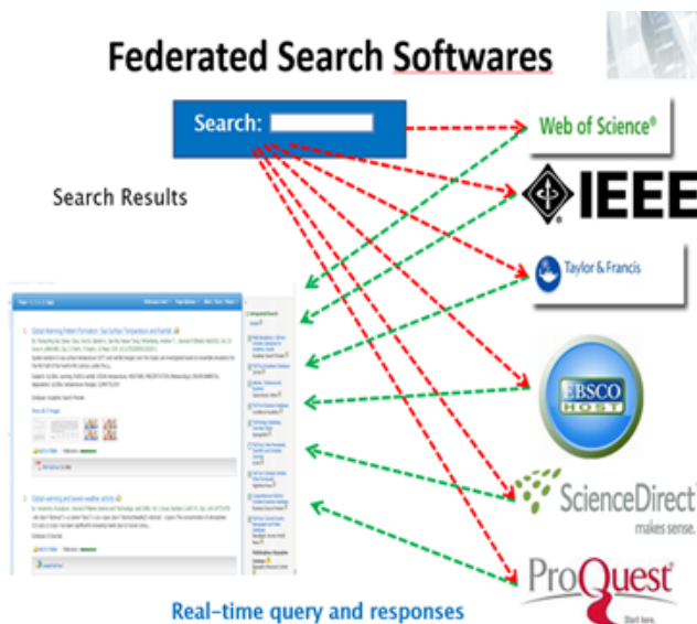
Figure 1. Architecture des outils de recherche fédérée des années 2000

connecteurs et l'hétérogénéité des métadonnées entre les bases en furent les principales faiblesses (cf. figure1).