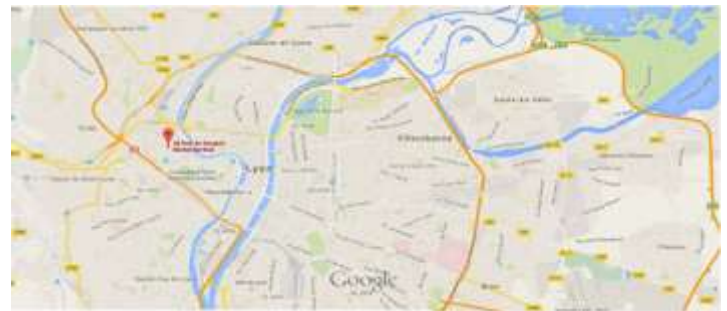
Figure 2 : Situation Rhodiacéta http://www.google.fr/maps