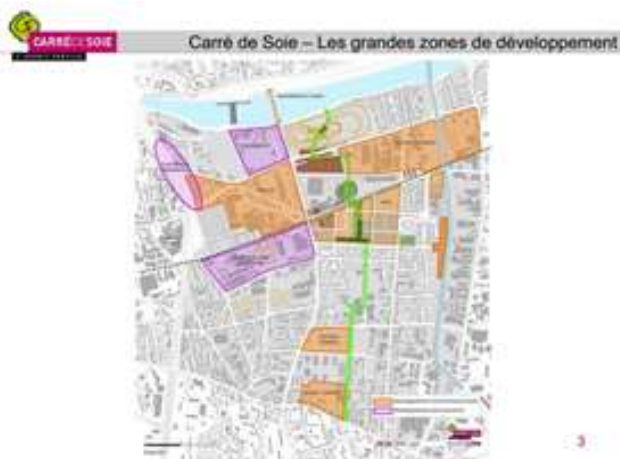
Figure 5 : « Carré de Soie L'esprit fertile », visite presse, 20 octobre 2011.

À partir du début des années 2000, le secteur de la 1 ère couronne de l'Est lyonnais est réinvesti de la part de la communauté urbaine du Grand Lyon dans le cadre d'une reconquête urbaine à travers notamment le projet urbain Carré de Soie . Ce projet vise la mutation urbaine d'un vaste secteur du centre-est de l'agglomération, situé sur les villes de Villeurbanne et de Vaulx-en-Velin (cf. figure 5). De ce fait, nous voyons que la focale d'agglomération se déplace vers l'Est lyonnais jusque-là boudé.