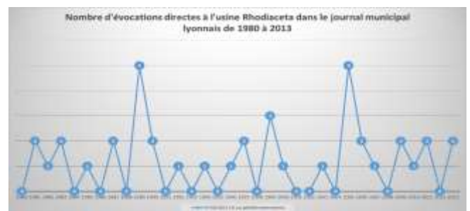
Figure 3 : Nombre d'évocations directes à l'usine Rhodiacéta dans le journal municipal lyonnais (1980-2013).