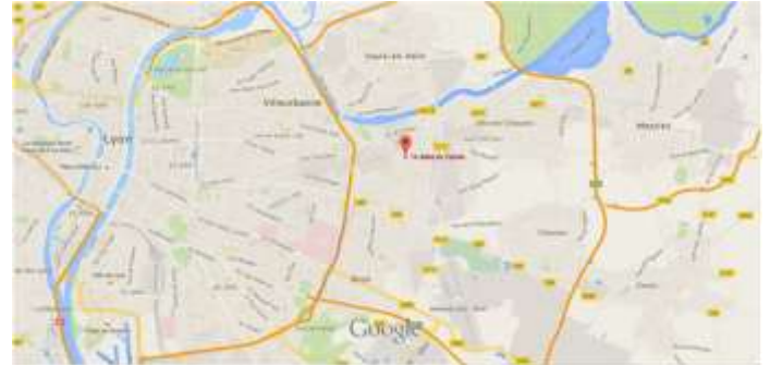
Figure 4 : Situation Tase : http://google.fr/maps