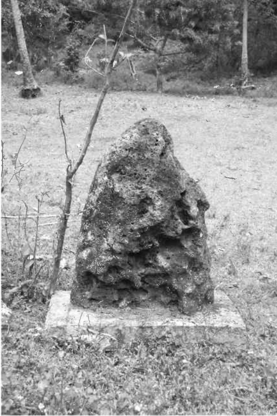
Figure 13 : A l'image des pierres ancestrales, la pierre fondatrice de Lamap Cité Nouvelle.

Mais le père Leymang décéda peu après, en 2002. Les chefs de lignages, les aînés, n'avaient soudainement plus au-dessus d'eux la figure politique, héroïque et religieuse que Leymang avait habilement jouée. Les lignages et leurs chefs se trouvèrent seuls face aux financiers et aux investisseurs, qu'ils aient été réels ou fictifs. Surtout, ils se trouvèrent face à eux-mêmes et entrèrent vite en conflit. Les uns, majoritaires dans un premier temps, pensaient qu'il fallait poursuivre l'aventure, que les