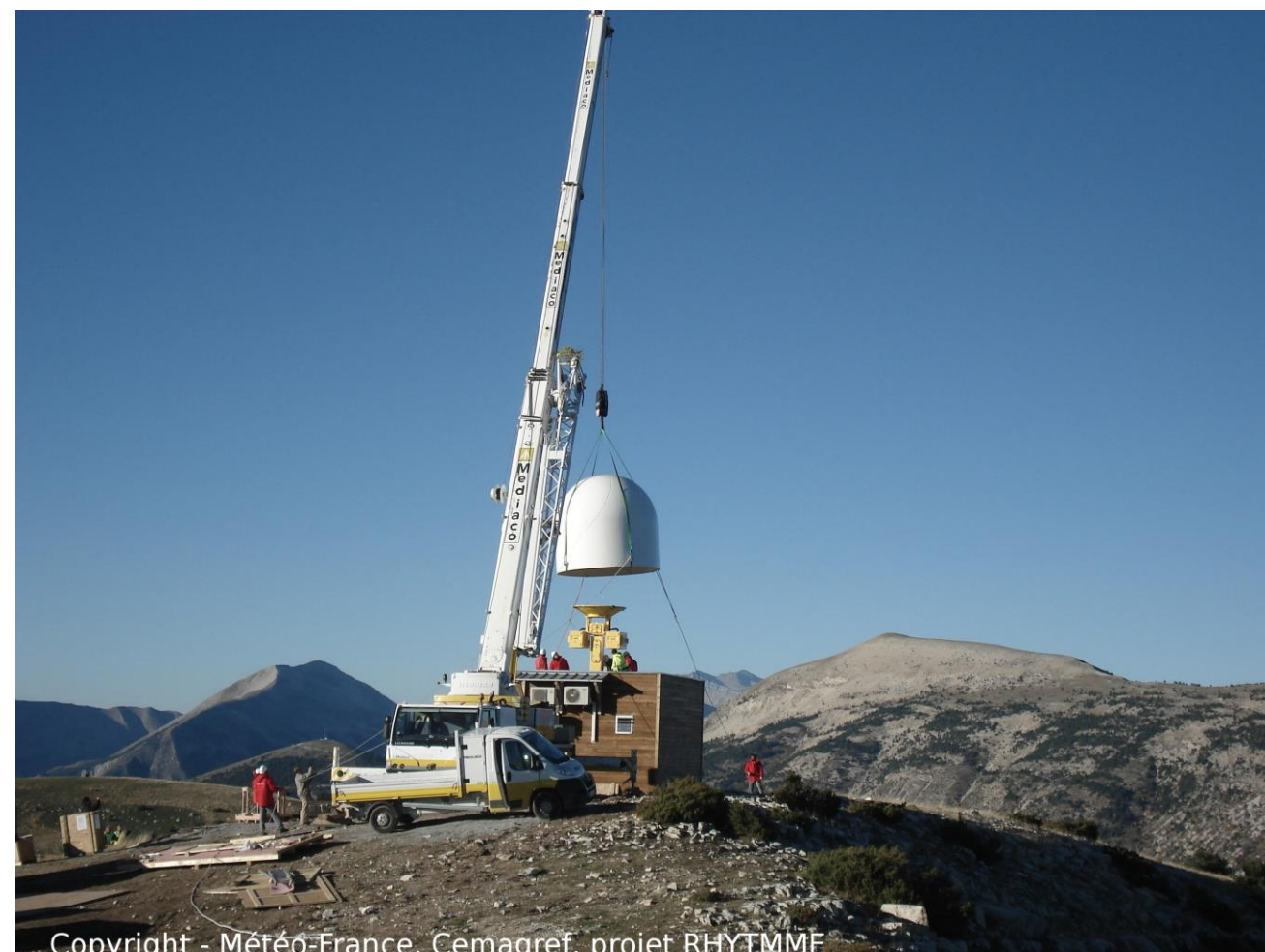
Installation le 20/10/2010 du radar de la Montagne de Maurel (04)

Contacts poster et article : Patrice MERIAUX, Samuel WESTRELIN, Jean-Luc CHEZE, Pierre TABARY, Pierre JAVELLE, Dimitri DEFRANCE