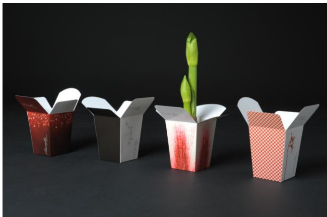
Illustration 5 : Amaryllis Box® 4

L'objectif de l'ensemble des entretiens menés était de confirmer (ou infirmer) les propositions déduites du focus group et d'approfondir certaines thématiques auprès de consommateurs mais également de professionnels du végétal. Ces entretiens, individuels et de groupe, nous ont ainsi permis de collecter de nombreuses données primaires, qui ont été complétées par le recueil de données secondaires externes (presse spécialisée, visite d'un salon du végétal et recueil d'informations techniques à cette occasion, visite et observation de points de vente, etc.) nous permettant de mieux appréhender ce secteur d'activité.