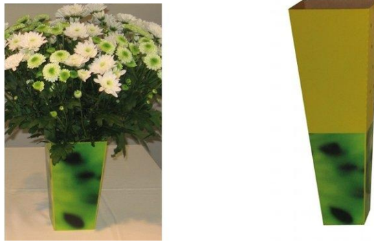
Illustration 3: Vase Easy'Fleur