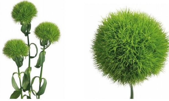
Illustration 2 : Œillet aux fleurs vertes en pompon ( Dianthus Barbatous Green Trick « Temarisou »)