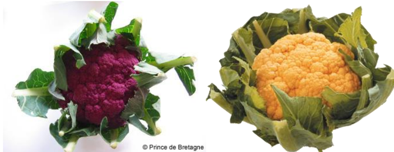
Illustration 1 : Chou-fleur violet et orange de la marque Prince de Bretagne

résultats issus d'une analyse qualitative exploratoire visant à mettre en évidence l'approche de l'innovation chez les consommateurs dans le secteur végétal.