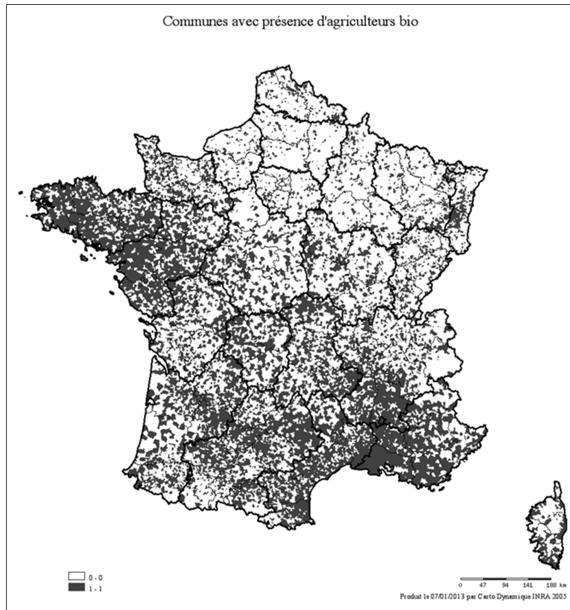
Carte 2. Communes avec au moins une exploitation en agriculture biologique certifiée

La variable binaire à expliquer dans les modèles (Carte 2) est construite au niveau communal.