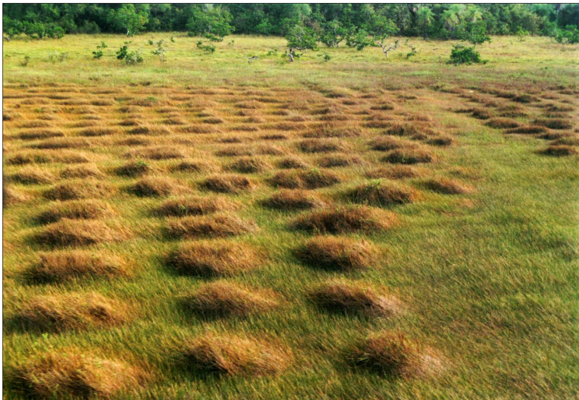
Figura 6 - Campos elevados del sitio Diamant, Guyana francesa (foto S. Rostain).

Entonces se trata de una agricultura monumental que fue elaborada por los habitantes precolombinos de las Guayanas. La importancia de estos movimientos de tierra es aún subestimado por algunos, que consideran que únicamente los colonizadores occidentales fueron inclinados a intentarlo, y capaces de efectuar, grandes transformaciones del paisaje. Mientras que el impacto de las comunidades indígenas precolombinas es de más en más