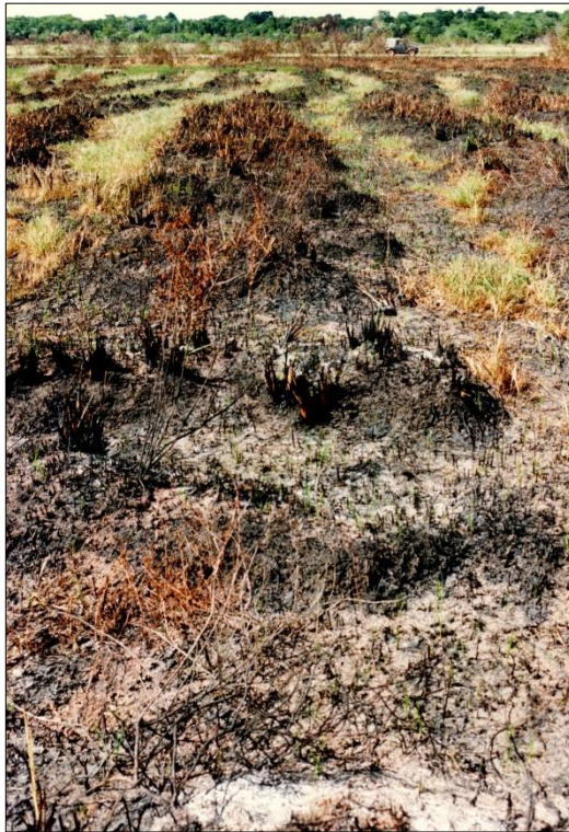
Figura 9 - Paisaje de tacurúes en Uruguay.