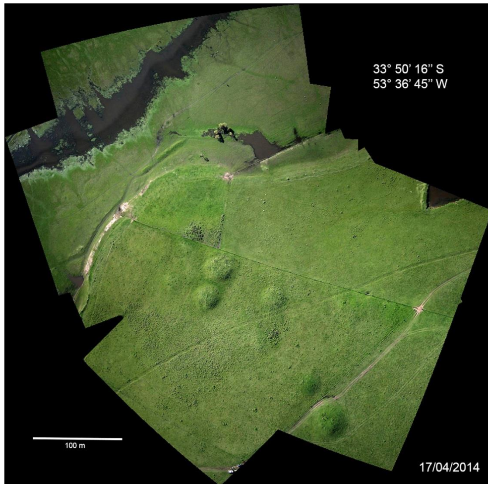
Figura 4 - Cerritos del sitio Arroyo de Los Indios.