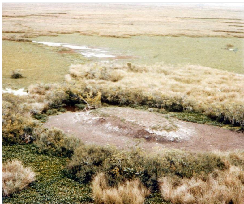
Figura 2 - Montículo antrópico de India Muerta, este de Uruguay (foto J. López Mazz)

El conjunto de los montículos del norte y este de Uruguay, y del sur de Brasil, están (o estuvieron) asociados a extensas zonas inundables (Figura 3). Existen montículos que están vinculados por su génesis y por su distancia a las zonas inundables. Otros montículos están más distantes de las zonas inundables; por lo que la elección de su emplazamiento respondió a otras necesidades humanas.