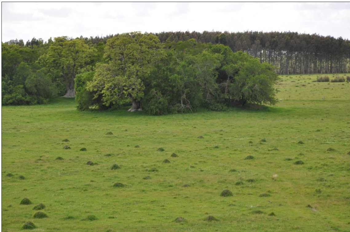
Figura 1 - Paisaje mixto de montículos, este de Uruguay: hormigueros al primer plano y montículo antrópico al fondo

Grandes proyectos interdisciplinarios han trabajado duro para demostrar que un paisaje de apariencia natural era de origen antrópico (ROSTAIN, 1991; LÓPEZ MAZZ, 1992; MCKEY et al. , 2010). Lo contrario también ha ocurrido, ya que estructuras consideradas como antrópicas resultaron ser de origen natural (MCKEY et al. , 2014; ROSTAIN et al. , 2014) Es con el desarrollo de excavaciones estratigráficas y sobretodo en área, en montículos, que se ha producido información nueva, específica y controlada; para discutir en profundidad los procesos de formación de los montículos (LÓPEZ MAZZ & BRACCO, 1994; MCKEY et al. , 2014; ROSTAIN & SAULIEU, 2014).