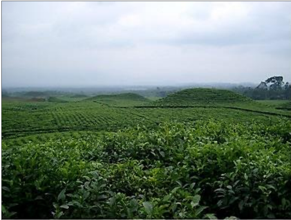
Figura 7 - Sitio Zulay, río Pastaza, Ecuador

Naturales o culturales, la identificación de montículos en las tierras bajas de Sudamérica no es un trabajo simple, cuando se trata de investigarlo. El proyecto “Arqueología de las tierras bajas de Sudamérica” (ECOS-Sud 2013-2014) no buscaba construir un inventario de los trabajos en tierra precolombinos y de las formaciones monticulares naturales, sino discernir las constantes de esas estructuras e intentar evaluar la parte de los actores en cada una de esas construcciones. Para hacer esto elaboramos una problemática común entre arqueólogos y ecólogos, y cada uno aportó respuestas desde sus metodologías propias.