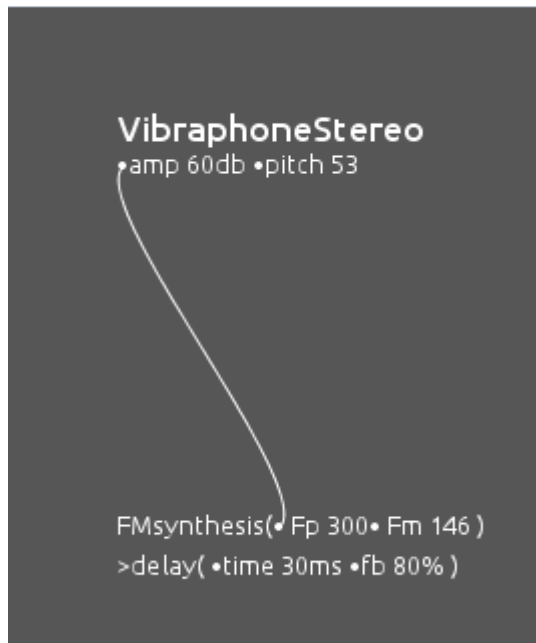
Figure 3. Capture d'une représentation arbitraire réalisée avec l'outil développé.

Une capture d'une représentation arbitraire est présentée en figure 3. Une lecture générale de celle-ci peut être la suivante : les informations d'amplitude et de hauteur sont extraites d'une source nommée « vibraphone stéréo ». Un module de synthèse par modulation de fréquence (FM) suivi d'un traitement de délai génère le flux audio. La fréquence porteuse de la synthèse FM est liée à l'amplitude de la source vibraphone stéréo.