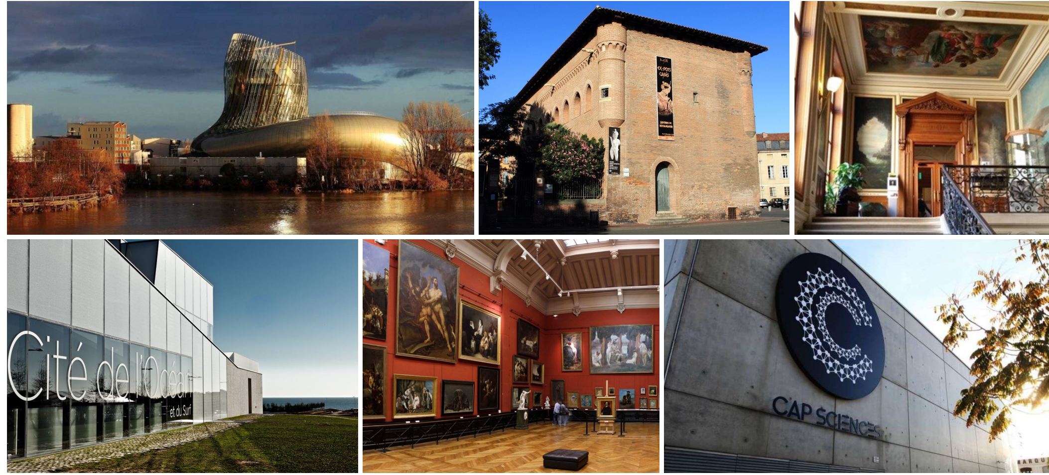
Cité du Vin (Bordeaux), Musée Saint-Raymond (Toulouse), Musée de minéralogie des Mines Paris Tech (Paris), Cité de l'Océan (Biarritz), Musée des Beaux-Arts, Cap Science (Bordeaux).

? Comment aider les professionnels des musées à créer ces parcours ?