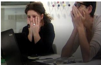
Figure 1 : Observations de l'exercice de création de parcours personnalisés multicritères. En haut, au musée Saint Raymond, la responsable du service des publics utilise des feuilles A3 et des post-its. Une grille représentant l'espace de conception était fournie (1680 parcours à créer). En bas, à la Cité du Vin, les responsables scientifique et de la médiation culturelle travaillent sur un ordinateur avec projection sur un écran vertical. La grille n'était pas fournie et elles ont éprouvé le besoin de créer un fichier Excel pour gérer la complexité de l'espace de conception (11.136 parcours). Les participantes ont donné leur consentement éclairé pour l'utilisation des vidéos.

However, the creation of the different visits is a long and complex task for the members of the museum staff who do not have the proper tools. The aim of this thesis is to propose a tangible tool to help them manage this complexity of their design space. We wish to ease the creation of a large number of visits, while preserving a creative design space.