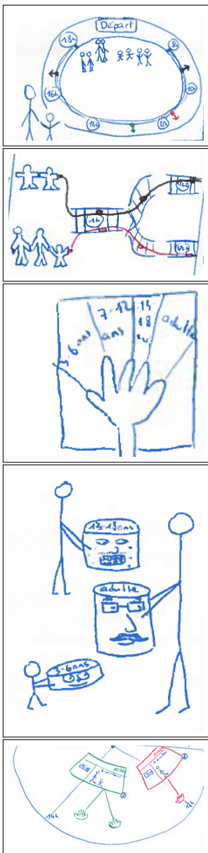
Figure 2: Extraits des storyboards S1 à S5, de haut en bas

de livres pour les bibliothèques qui améliore la participation des visiteurs grâce à son apparence attrayante et son approche ludique. Voxbox [8], un dispositif de recueil de l'opinion du publique, permet quant à lui d'attirer l'attention des passants et encourage leur participation.