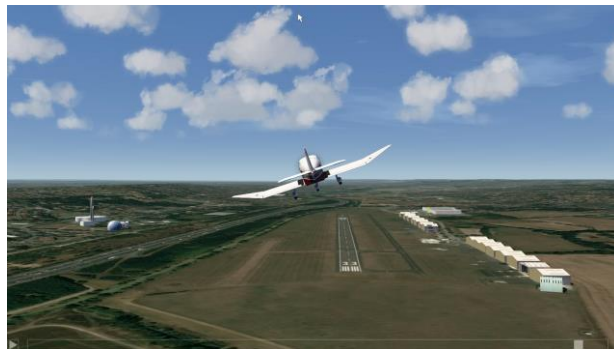
Figure 3: Aérodrome de Toulouse-Lasbordes et ses repères

Un scénario de vol, défini avec les pilotes instructeurs, consistait en une succession de tours de pistes. Un tour de piste, qui dure environ 8mn, est composé des phases suivantes : décollage, montée initiale, virage en montée, mise en palier, virage en palier, préparation machine (action volets), virage en descente, descente stabilisée,