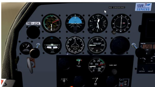
Figure 2: Cockpit DR400 F-GTPZ de Lasbordes (haut), cockpit DR400 Aerofly2 modifié (bas).