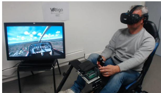
Figure 1: Plateforme VRtigo