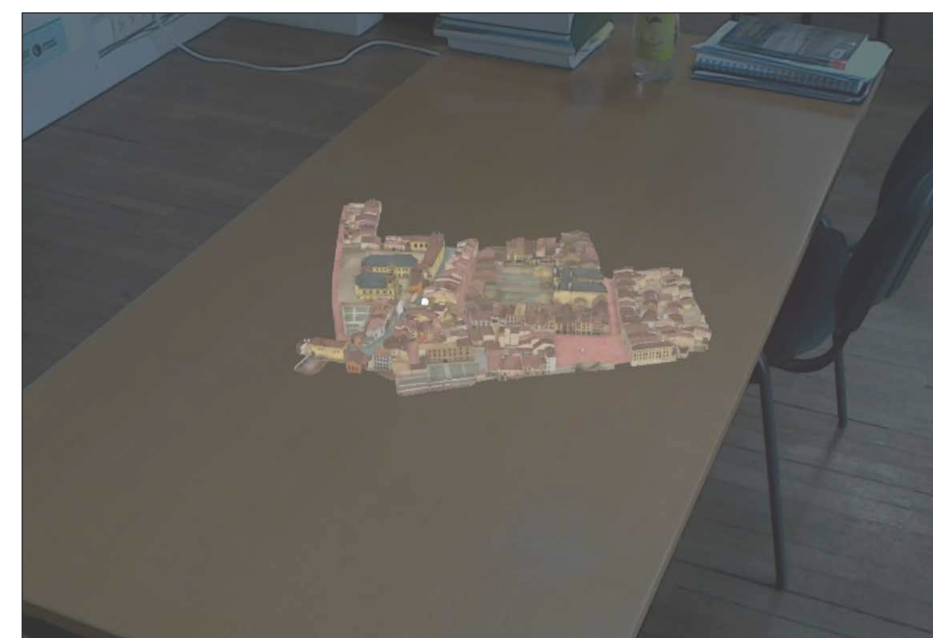
Figure 3 -Insertion d'une maquette virtuelle sur une table au CRAI

Un atout majeur de la réalité mixte est le fait de ne pas être contraint par la gravité. Contrairement à une maquette, il est possible d' enlever les couches comme la toiture, la structure ou les menuiseries, sans que cela s'effondre. Il est aussi possible de faire une axonométrie éclatée . Il est plus facile d' interagir avec cette modélisation , changer la couleur d'un matériau, mettre en avant une partie du bâtiment ou encore faire une coupe.