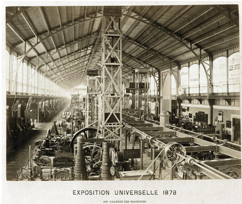
Fig. 2 : Anonyme, Galerie des machines de l'Exposition universelle, 1878

Cette fascination est révélée par l'omniprésence des hyperboles de ses émotions ( ital. ), renforcées par un oxymore digne du sublime kantien, celui d'un « enthousiasme » causant des « larmes aux yeux ». La multiplication des objets au pluriel communique également l'envahissement de ces outils. Le polyptote constant des « machines » les transforme quant à lui en une seule machine anonyme qui règne sur tout, et permet à l'écrivain d'en tirer des comparaisons légendaires : une nature divine et toute-puissante personnifiée, qui domine les hommes ( gras ). Or, les seuls éléments concrets de ces machines deviennent inconsciemment des intermédiaires de l'écriture : le fil, la ligne et le tissu, renvoyant étymologiquement au « texte ». À la même époque, Huysmans manifeste lui aussi une exaltation des paysages forgés par l'ingénierie :