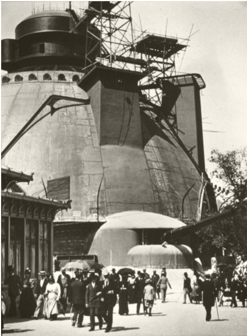
Fig. 3 : Émile Zola, Paris, l'Exposition , 1900 Toulouse, Le Château d'Eau

Les photographies de Zola de l'Exposition universelle de 1900 expriment un hypnotisme abstrait des usines où l'homme est totalement absent ( fig. 3 ).