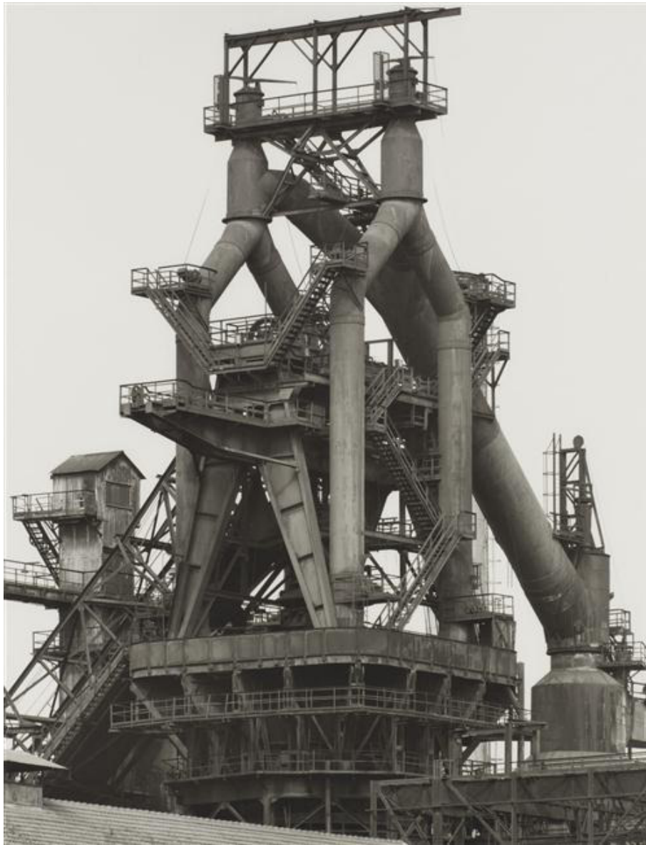
Fig. 4 : Bernd et Hilla Becher, Sans titre (Homecourt, Lorraine), série Têtes de Hauts Fourneaux , 1980 Paris, Centre Pompidou - Musée national d'art moderne, Centre de création industrielle.

industrielles désincarnées des photographes contemporains Bernd et Hilla Becher (fig. 4).