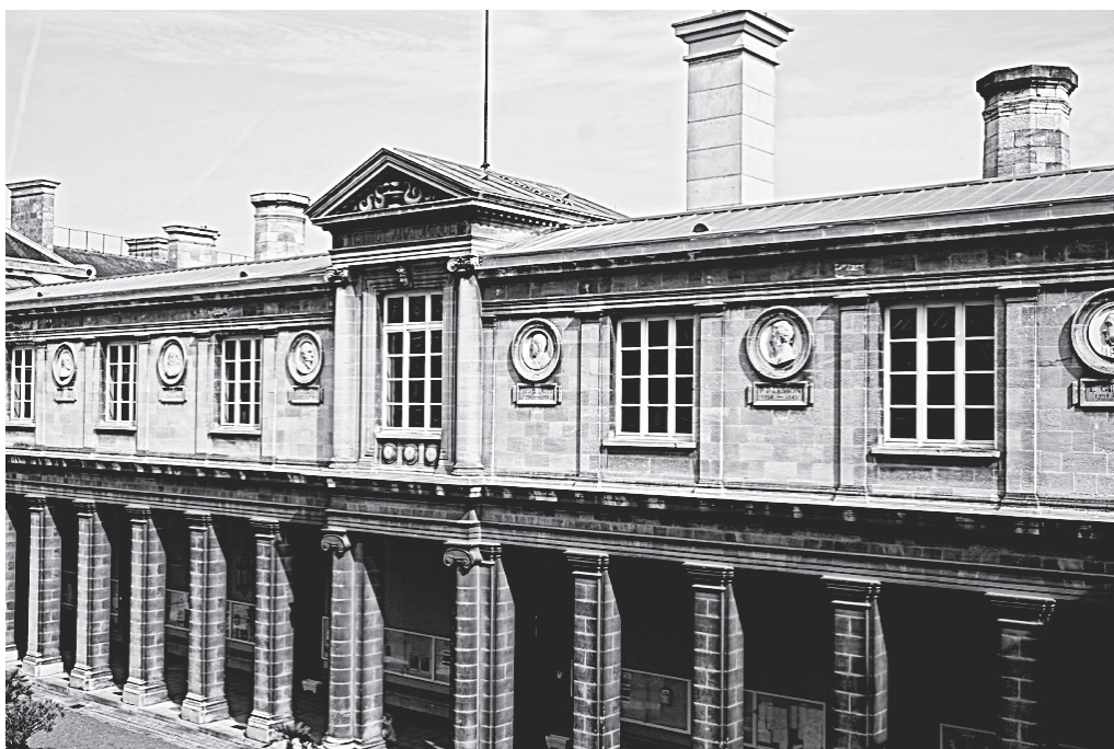
Fig. 3. Vue sud de la cour d'honneur de l'ancienne faculté de médecine et de pharmacie (aujourd'hui université de Bordeaux, site Victoire).

Louis Pierre Gratiolet, professeur de zoologie à la faculté de sciences de l'université de Paris. Élie Gintrac 29 (1791-1877), quant à lui, se distingue par sa carrière à l'École bordelaise de médecine et par sa défense farouche de la création d'une faculté.