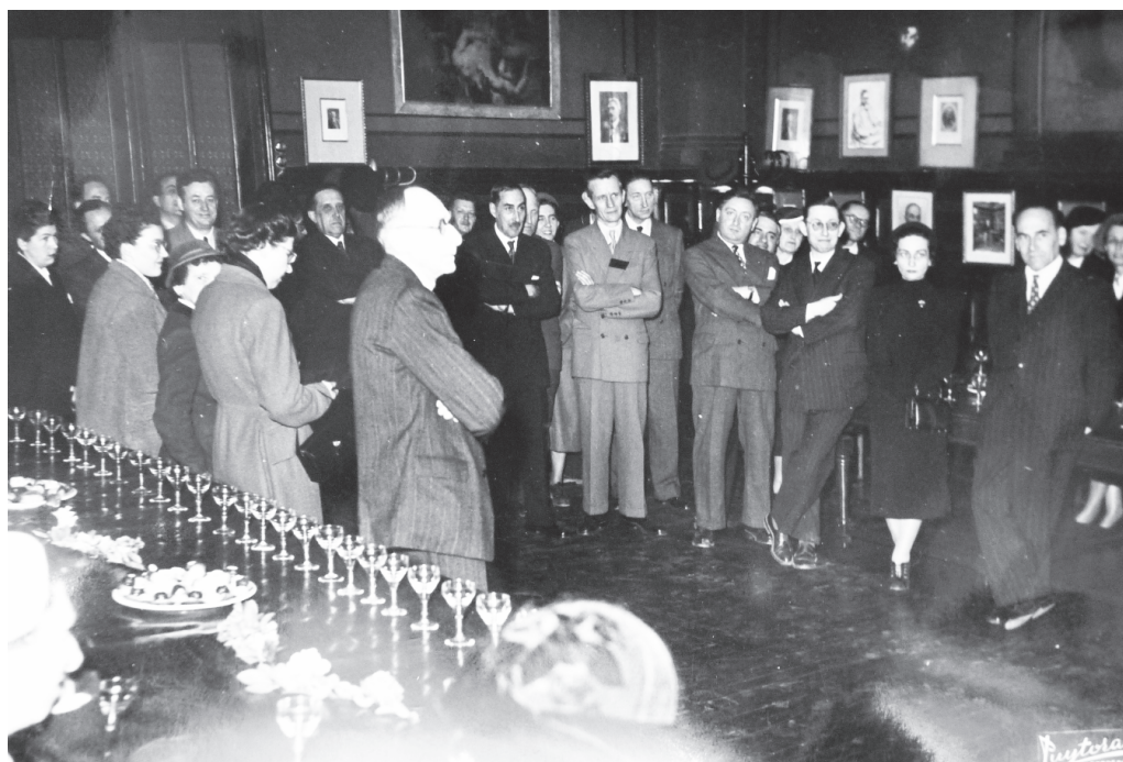
Fig. 4. André Puytorac, Cérémonie en l'honneur du professeur René Vallois, dans la salle des actes de l'ancienne faculté de sciences et de lettres (aujourd'hui musée d'Aquitaine), s.d. (1957 ?).

qui figuraient dans cette salle sont aujourd'hui conservés aux archives départementales de la Gironde. Il s'agit essentiellement de photographies ou de reproductions à partir de photographies. Les enseignants arborent peu la robe universitaire, préférant leurs habits civils. Le professeur de physique Joseph Abria, doyen de la faculté de sciences entre 1845 et 1887, est représenté en buste, selon des modalités qui rappellent l'austérité et la forme du daguerréotype, dans une redingote au revers de laquelle se distingue la rosette. Son plus jeune contemporain, l'astronome Georges Rayet, directeur de l'observatoire de Floirac entre 1878 et 1906, est représenté de même en civil mais dans une posture naturelle, appuyé sur le dossier de la chaise, la tête détournée du spectateur. Plus atypique au sein de ce corpus est le portrait de Georges Cirot à sa table de travail, dans son bureau de la faculté. Cette mise en scène du professeur d'études hispaniques, qui fut doyen de la faculté des lettres entre 1922 et 1937, prend pour modèle la série Nos contemporains chez eux (1887-1917) réalisée par Dornac, où des personnalités de la vie intellectuelle étaient saisies ainsi « à l'œuvre 67 ». La référence à la communauté universitaire au travers du costume y est moins