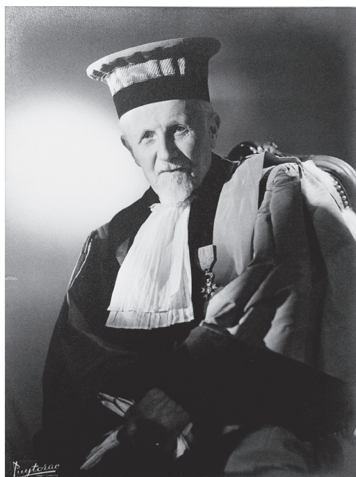
Fig. 5. André Puytorac, Portrait en robe d'Henri Devaux, s.d.

systematisée. Il faut néanmoins remarquer la tentative de renouveler le portrait en robe chez André Puytorac (fig. 5), photographe bordelais qui immortalisa Henri Devaux (1862-1956), professeur de physiologie végétale, selon une mise en lumière et une composition proches du studio parisien Harcourt, spécialisé dans les portraits de personnalités issues du milieu du cinéma. Cette démarche montre le désir de s'approprier de nouveaux codes de représentation susceptibles de conférer un certain prestige à la fonction universitaire.