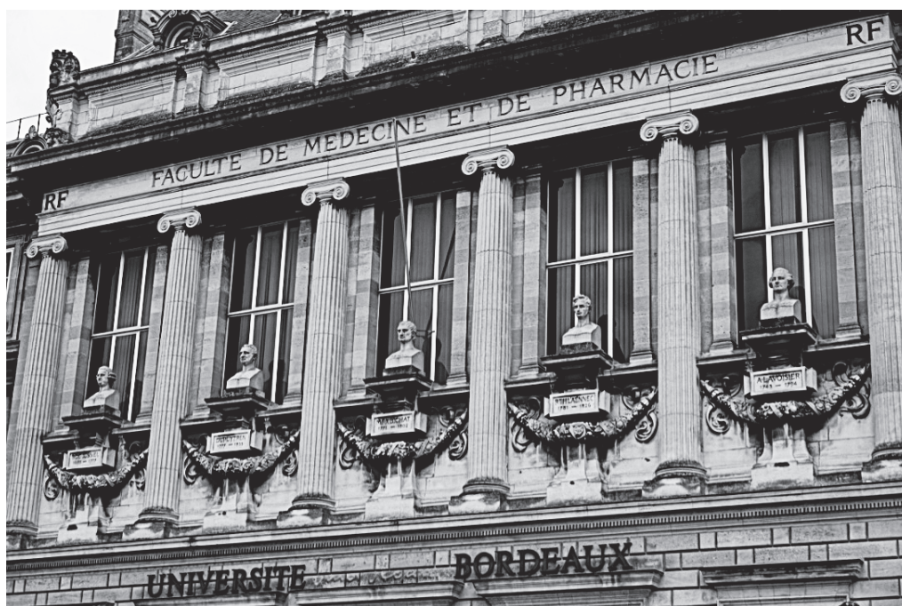
Fig. 1. Vue de l'élévation actuelle de la façade de l'ancienne faculté de médecine et de pharmacie (aujourd'hui université de Bordeaux, site Victoire).