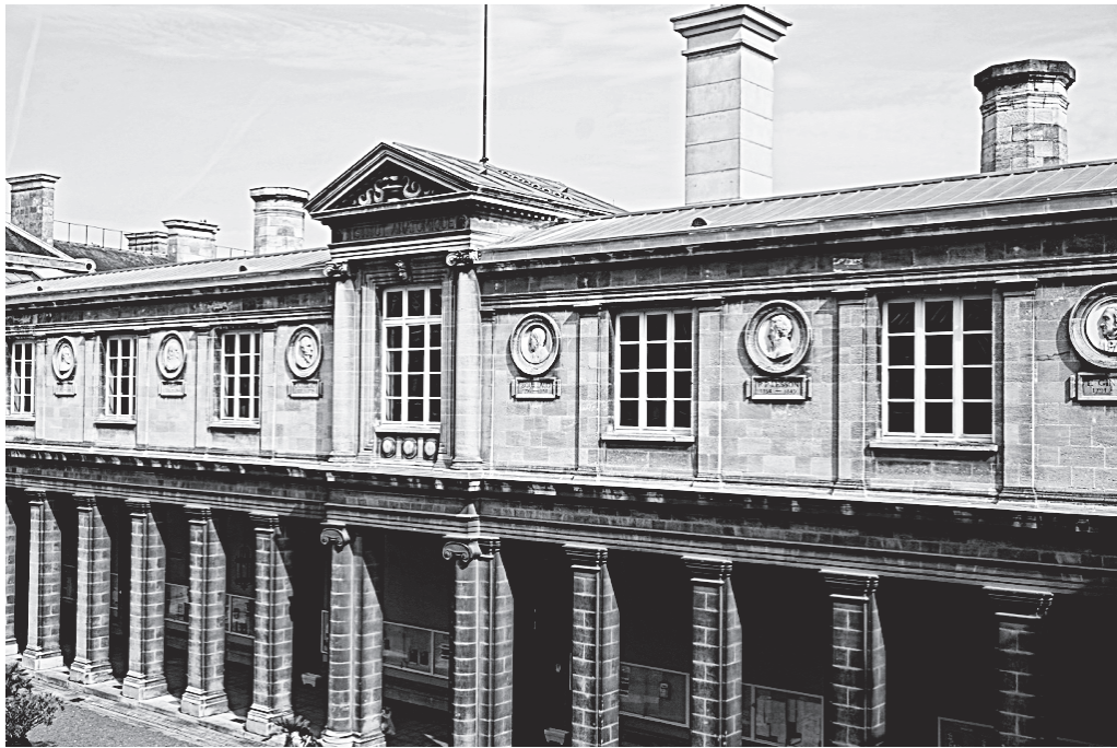
Fig. 3. Vue sud de la cour d'honneur de l'ancienne faculté de médecine et de pharmacie (aujourd'hui université de Bordeaux, site Victoire).

Louis Pierre Gratiolet, professeur de zoologie à la faculté de sciences de l'université de Paris. Élie Gintrac 29 (1791-1877), quant à lui, se distingue par sa carrière à l'École bordelaise de médecine et par sa défense farouche de la création d'une faculté.