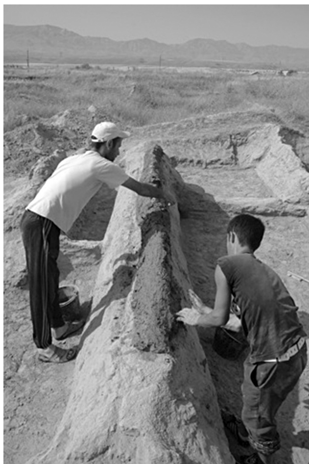
Fig. 5. Expérimentation sur le chantier 5 de Sarazm, Tadjikistan