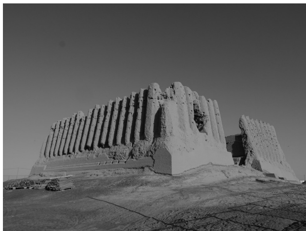
Fig. 4. Greater Kyz Kala, Turkmenistan © CRAterre - C. Sadozai.