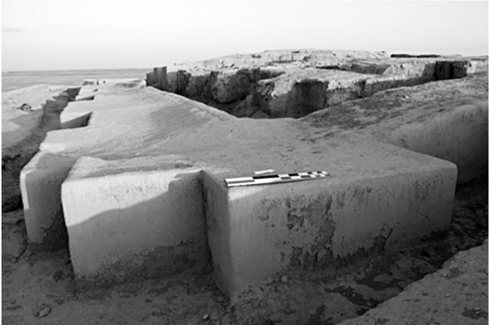
Fig. 2. Citadelle d'Ulug Dêpe, Turkménistan © MAFTUR – P. Hamouda.

des phénomènes tels que l'évaporation, l'occupation par des animaux/oiseaux ou encore l'abrasion par le vent. Cependant, cette technique se révèle efficace dans certains cas (fig. 3).