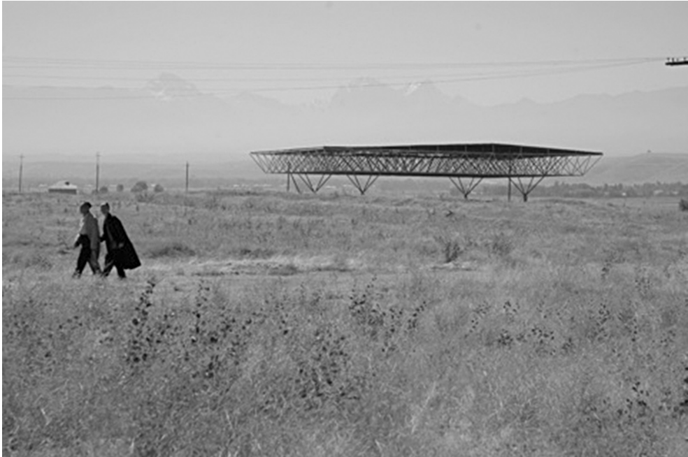
Fig. 3. Vue d'ensemble d'un des chantiers couvert de Sarazm, Tadjikistan © CRAterre - C. Sadozaï.

expertise internationale depuis 1999, dans le cadre d'un partenariat impliquant le Ministère de la Culture turkmène (National Department for the Protection, Study and Restoration of Historical and Cultural Monuments), l'University College of London, et CRAterre-ENSAG (Gandreau/Moriset 2011).