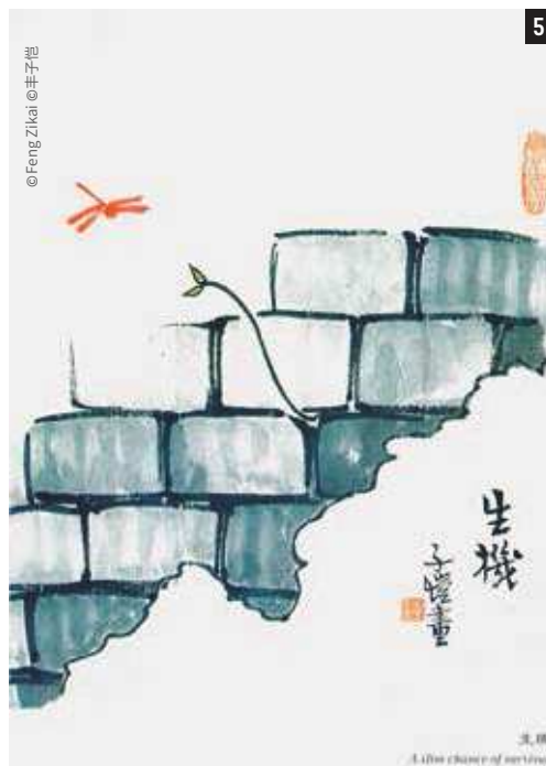
生机 A little chance of survival.

描绘之一。这些底层职业者画像都是他在上海以及周边地区观察并速写出来的(见29页上图)。