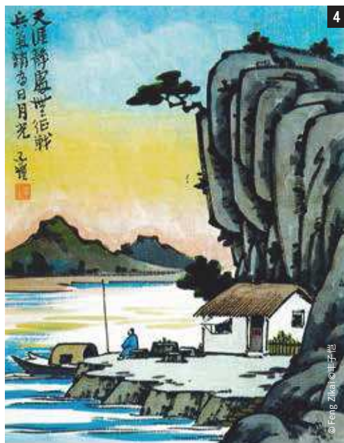
天涯静处无征战,兵器销为日月光 Far away from the man's world, there's no war; Weapons of all sorts have vanished into the light of Sun and Moon.