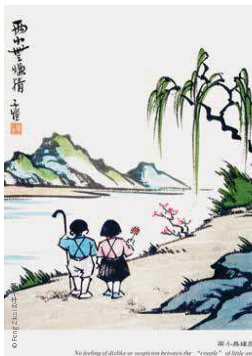
No feeling of dislike or suspicion between the "couple" of little one

côté la métropole moderne, la société et ses vicissitudes, de l'autre le monde de l'enfance et de la nature où il croit retrouver les valeurs du passé. Ainsi, loin de réfuter la peinture traditionnelle, il la modernise à sa manière par un style dépouillé presque naïf reconnaissable au premier coup d'œil, par certains motifs contemporains (train, voiture, ascenseur, poste de radio, lampe électrique...), mais aussi par le rôle inédit qu'il confère aux femmes et aux enfants autrefois cantonnés dans des représentations stéréotypées. Une œuvre comme Deux petits êtres que ne sépare aucun soupçon illustre parfaitement tous ces principes, tout en renouant subtilement avec une tradition qu'il admire, et dont il s'est fait l'ardent défenseur en la déclarant supérieure à toute autre de par sa dimension spirituelle et non mimétique (voir illustration ci-dessus). Ce sont deux enfants, ces êtres de nature qu'il se donne pour modèles, qui font ici l'expérience d'élévation d'esprit