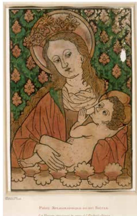
Anonyme allemand Vierge à l'Enfant Vers 1460, gravure sur bois coloriée, 27,1 x 18,1 cm. 11 LR, recto.