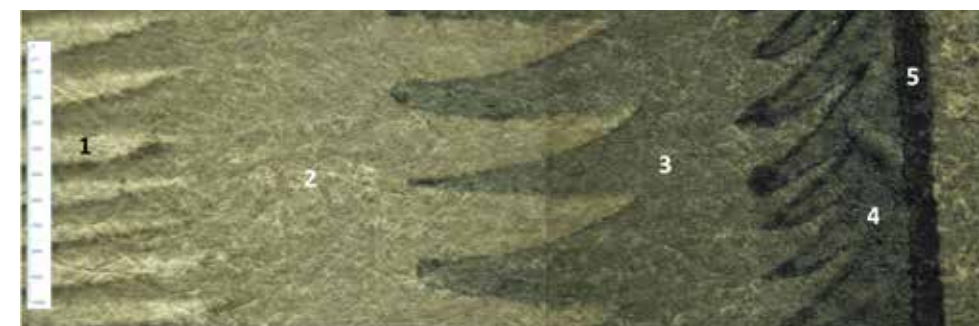
Ci-contre La macrophotographie de l'estampe David jouant de la harpe pour apaiser Saül permet d'observer :

(1) le papier, (2) l'encre verte de la 1 re planche de teinte, (3) l'encre verte de la 2 e planche de teinte, (4) l'encre verte de la 3 e planche de teinte, (5) l'encre noire de la planche de trait.