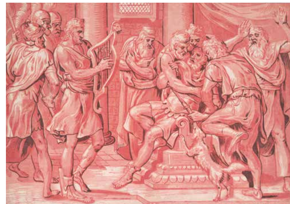
Ci-contre Image IRFC de l'estampe David jouant de la harpe pour apaiser Saül.