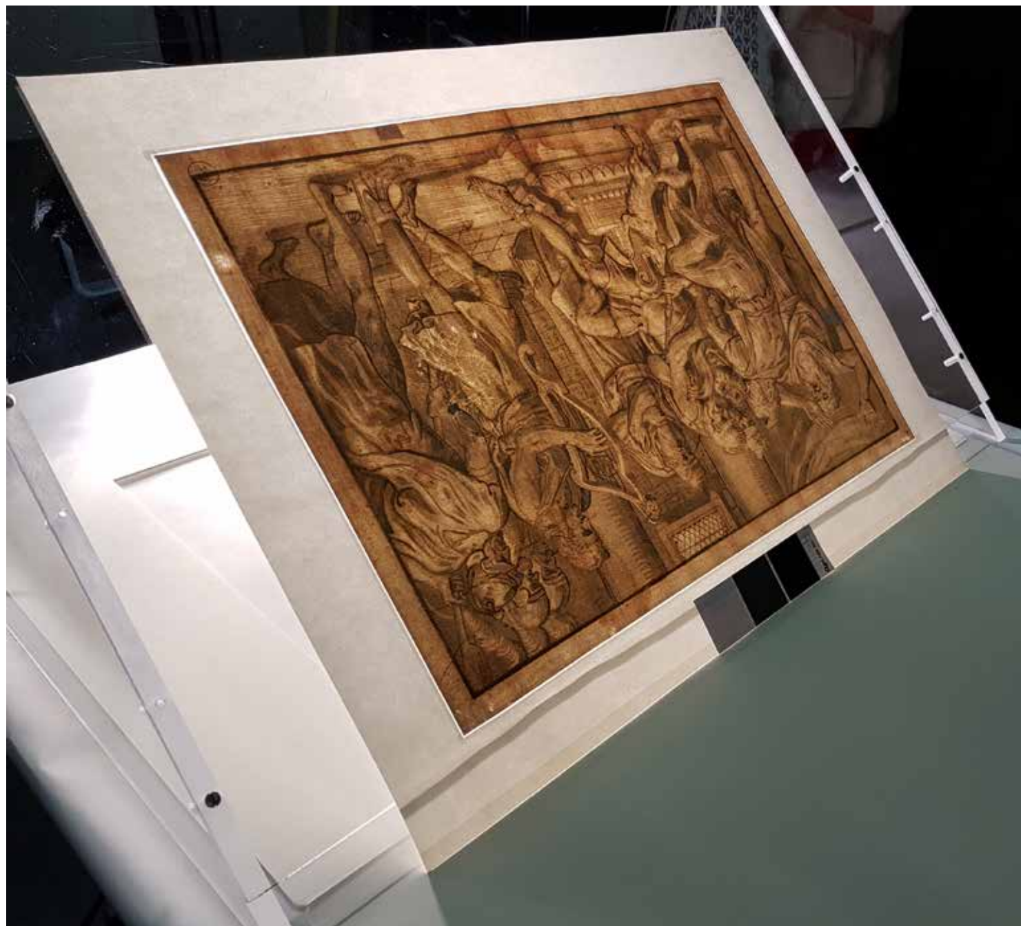
Dispositif pour la photographie par lumière transmise, avec l'estampe David jouant de la harpe pour apaiser Saül . On peut observer le filigrane au niveau de David jouant de la harpe.

question de la nature physique des encres et de la manière dont elles ont été apposées sur une feuille à l'impression n'a, quant à elle, pas retenu l'attention des spécialistes jusqu'à présent. Or, l'étude scientifique des composants de ces encres nous semble de nature à ouvrir d'autres voies d'exploration qu'une étude reposant souvent sur les fondamentaux du connoisseurship .