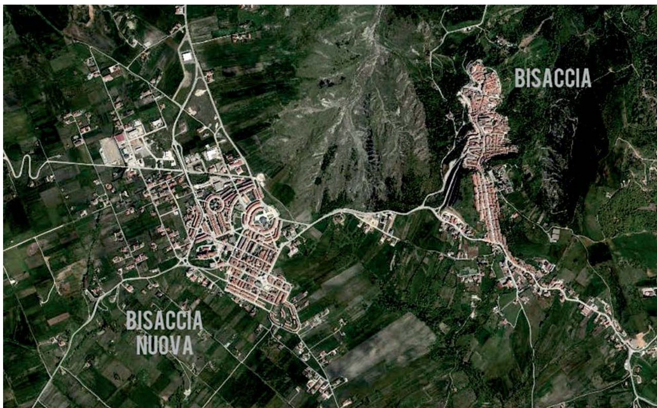
Fig.1 – Il paese di Bisaccia, prima del 1980, si collocava solo nella parte est. Dopo il terremoto è stato costruito Bisaccia Nuova, sulla collina di fronte ad ovest, chiamato ancora ad oggi dagli abitanti 'Piano Regolatore'. La popolazione, dopo un lieve incremento durante gli anni 80, è sempre diminuita (Google Maps, 2017).

Il risultato di questa scelta è una frammentazione del paesaggio e un'espansione significativa di tanti paesi che invece non hanno avuto un incremento della popolazione, bensì una diminuzione. Bisaccia (Fig.1) è uno degli esempi più rappresentativi.