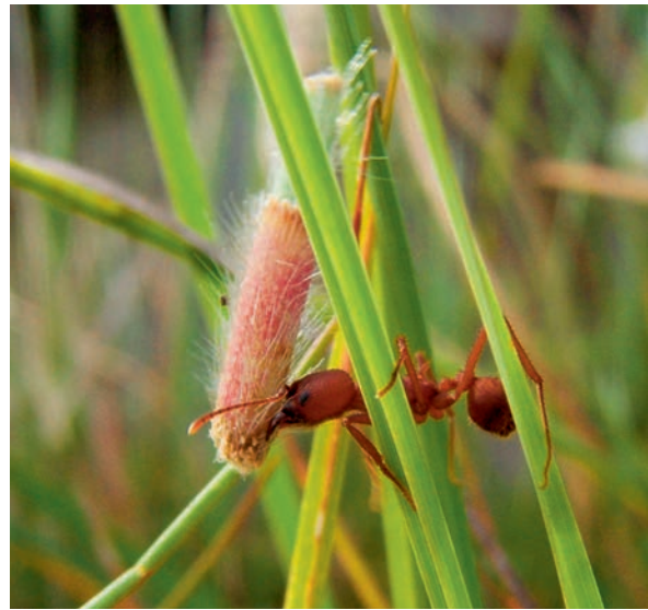
Fourmi champignonniste Acromyrmex , espèce qui participe au maintien des champs surélevés.

Les observations et les expérimentations réalisées durant trois ans ont permis de démontrer l'action effective des ingénieurs naturels d'écosystème et d'élaborer