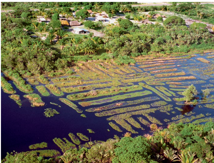
Champs surélevés de Piliwa, extrême ouest de la Guyane française.

comme ceux du Guyana et du Venezuela, mais construits dans les marais côtiers. Ils sont organisés par groupes ou en damiers et localisés entre les marécages et les formations de cheniers sableux.