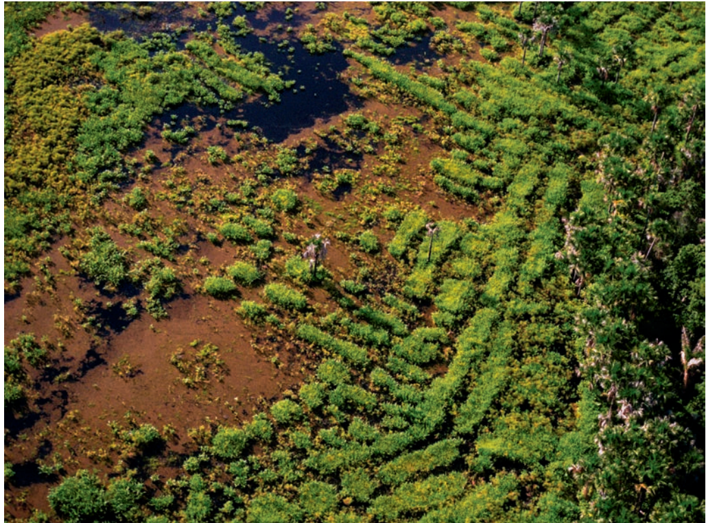
Champs surélevés à l'Est du Suriname, près de sa frontière avec la Guyane française.