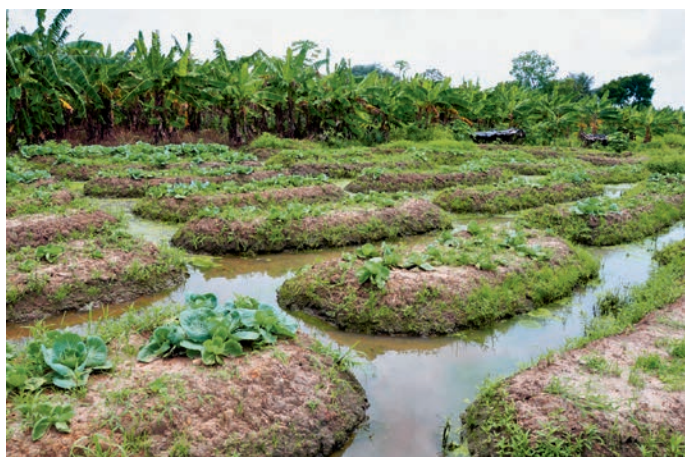
Petits champs surélevés haïtiens actuels près de Kourou, Guyane française.

La technique des champs surélevés disparaît aux alentours de la conquête européenne. Seuls de rares textes la signalent encore à l'époque coloniale sur la côte des Guyanes. De nos jours, quelques paysans noirs-marrons ou haïtiens surélèvent parfois leurs plantations au moyen des "planches agricoles". Ces structures ne sont cependant pas identiques aux complexes amérindiens en termes de surfaces cultivées. Elles sont en effet édifiées sur de petits espaces au sommet des barres sableuses non inondables, et jamais