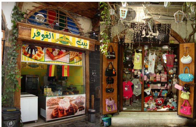
Figure 5 : Casse-croûte et magasin d'accessoires de mode de la rue Al-Qeimarieh