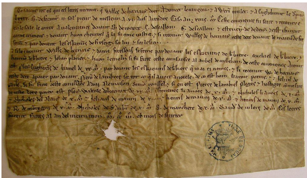
[Abb. 1: Le plus ancien acte en français– AMD FF 900 (Février 1204)]

Avons-nous là un unicum ou le vestige d'un type d'actes en langue vernaculaire qui n'a pas été conservé par ailleurs ? Il est difficile de trancher : la plupart des transactions de ce genre était alors menée exclusivement à l'oral comme le montre la pratique des records échevinaux encore attestée au siècle suivant 51 . D'un côté, l'importance de l'achat, garanti sur des biens fonciers et à hauteur de 110 marcs, a pu favoriser une mise par écrit exceptionnelle 52 . Mais comme cette période est antérieure au développement du souci archivistique de la « troisième révolution de l'écrit », il est fort possible que ce type d'actes privés n'ait tout simplement pas laissé d'autre trace. D'ailleurs, la raison pour laquelle ce parchemin s'est retrouvé aux Archives communales reste mystérieuse 53 .