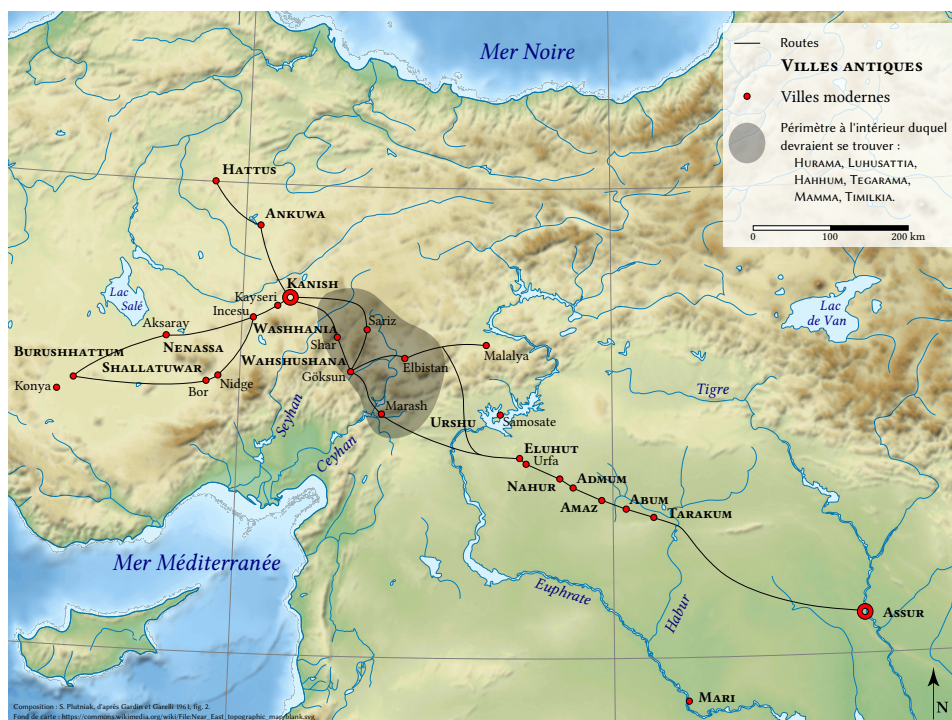
FIGURE 1 – L’expansion commerciale assyrienne au XIX e siècle av. J.-C. (d’après la figure 2 de Gardin & Garelli (1961); voir aussi la p. 838 de cet article).

concernant l’analyse de graphes en sciences historiques. Toutefois, au cours de la dernière décennie, il a été signalé dans plusieurs travaux de nature historiographique, signés par des acteurs et actrices des applications mathématiques en sciences historiques (Perriault (2012), Moscati (2016), etc.).