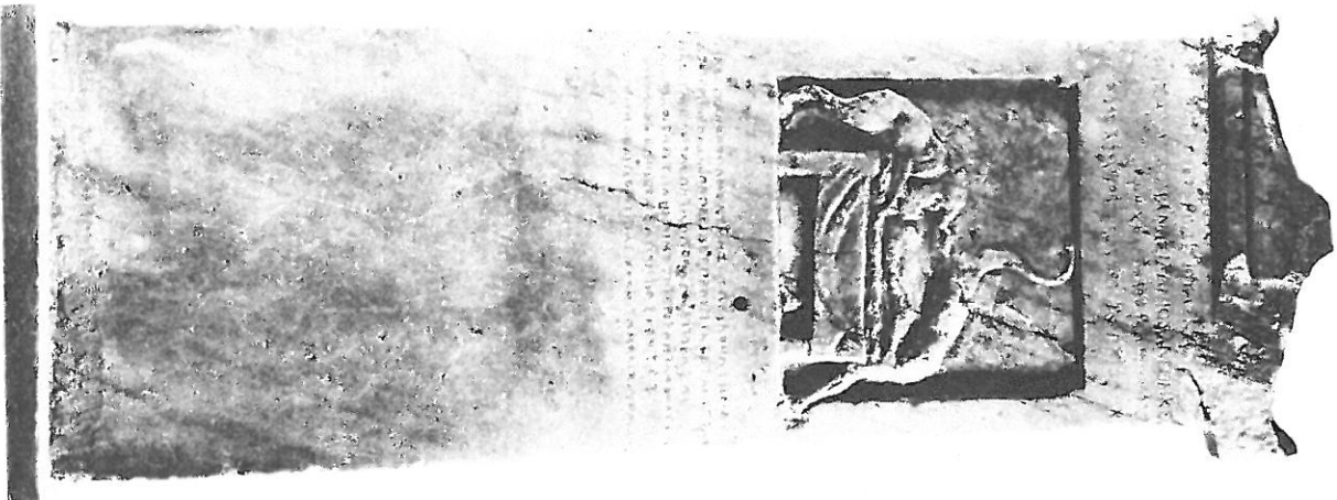
La stèle CIS I, 115.