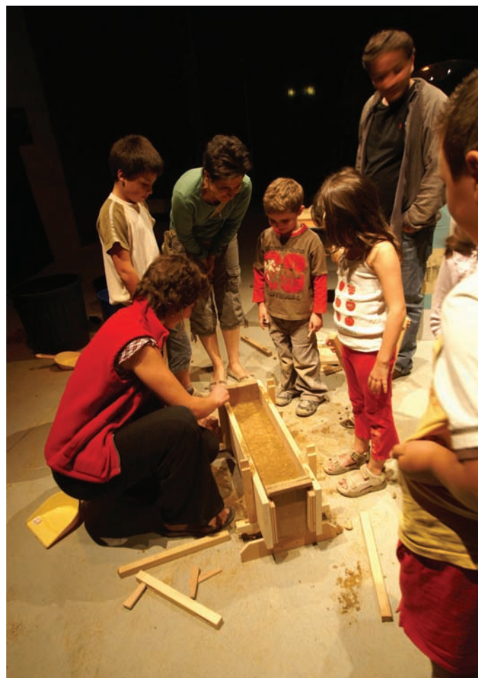
Fig. 6 Atelier « Apprentis maçons piseurs »

Pour l'équipe du CCSTI de Chambéry, c'est la première exposition pour laquelle elle a pu s'investir dans la conception. Montrer en direct des expériences de physique et manipuler la matière sont des pratiques qui existaient en amont de la création de l'exposition Grains de Bâisseurs dans les activités de la Turbine. Depuis la diffusion de cette exposition (fig. 5), elles sont devenues incontournables.