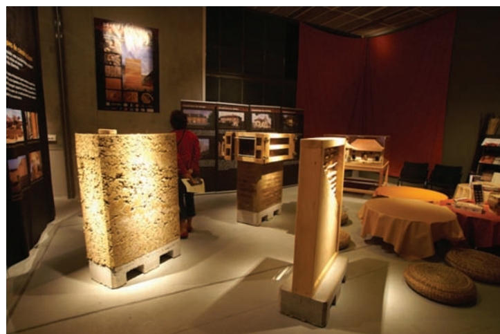
Fig. 4 Murs et techniques de construction

Pour mettre en valeur la matière, la scénographie de « Grains de Bâisseurs » a été pensée avec des matériaux propices à l'expérimentation, « fragiles », mais tous issus du monde des bâtisseurs : de l'atelier de charpente (établis) au chantier de maçonnerie (contreplaqué de coffrage). Dans ce cadre, le contact avec la matière est fondamental et le matériel utilisé pour mettre en œuvre les expériences brille par son absence. Ce choix implique une rénovation de l'exposition tous les dix ans. Dans l'avenir, se pose la question du passage ou non à un stade d'artificialisation et d'éléments plus conceptuels dans la logique adoptée par Universcience. Les éléments d'exposition de « Ma terre première, pour construire demain » ont été majoritairement réalisés en matériaux synthétiques et sont donc moins altérés par le temps et le nombre de visiteurs.