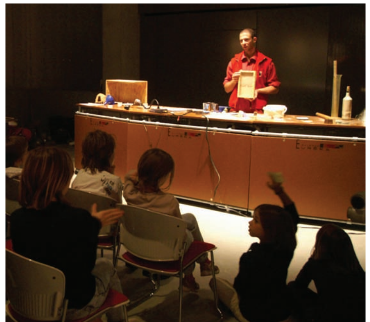
Fig. 3 Conférence/manipe l'« expérimentarium »

La terre n'était pas, a priori, un sujet d'exposition repéré par le CCSTI de Chambéry. C'est l'expérience et l'expertise des personnes proposant cette exposition sur le sujet de la terre crue qui ont poussé la Galerie Euréka à se lancer dans la coproduction de l'exposition. Dans le but de faire découvrir le territoire et ses ressources et d'impliquer le public dans de nouveaux ateliers, le CCSTI la Turbine a mis en