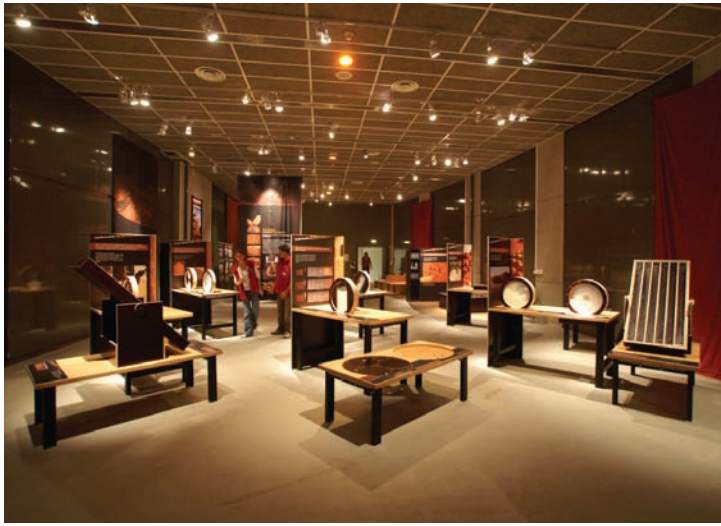
Fig. 1 Vue de l'exposition présentée à la galerie Euréka, à Chambéry