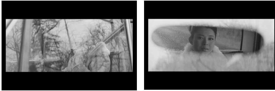
N° 1 – 2 – 3 – 4 - Amours dans la neige (1968) Kijū Yoshida

On sait que la disparition du second plan , qui sera également l'une des préoccupations des peintres impressionnistes et postimpressionnistes (Seurat, Cézanne, Monet, Van Gogh), fut une des plus importantes conséquences du greffon de la perspectiva artificialis , et des techniques du clair-obscur, sur les schèmes visuels japonais. Je me permets de citer à nouveau Inaga : « Leur critique des plans étagés traditionnels les amène à poser un horizon extrêmement bas sur la toile conventionnelle du kakemono (format vertical) [...]. Le résultat en est la superposition hardie du premier plan sur l'arrière-plan. [...] Voilà qu'apparaît une composition étrange où le gros plan se superpose à l'arrière-plan sans interposition de second plan intermédiaire 9 . » L'idée générale est la suivante : là où la perspective linéaire avait été inventée pour unifier l'espace, sa greffe sur les procédures visuelles japonaises tendant à la planéité a, au contraire, eu pour conséquence d'évacuer les plans intermédiaires et donc de produire de violents effets d'hétérogénéité entre le proche et l'éloigné.