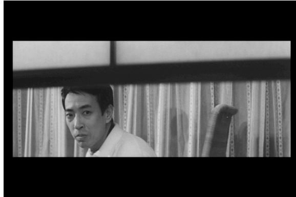
N° 6 - Amours dans la neige

un carré vide dans le shōji (un peu comme dans le jeu du puzzle à retrouver en faisant coulisser les pièces) – la case en question est ironiquement celle de la figuration mimétique saturée... –, où le papier manque (donnée troublante : on n'en connaîtra pas la raison narrative) ; et Sugino se tient derrière le shōji , dans la profondeur de la pièce.