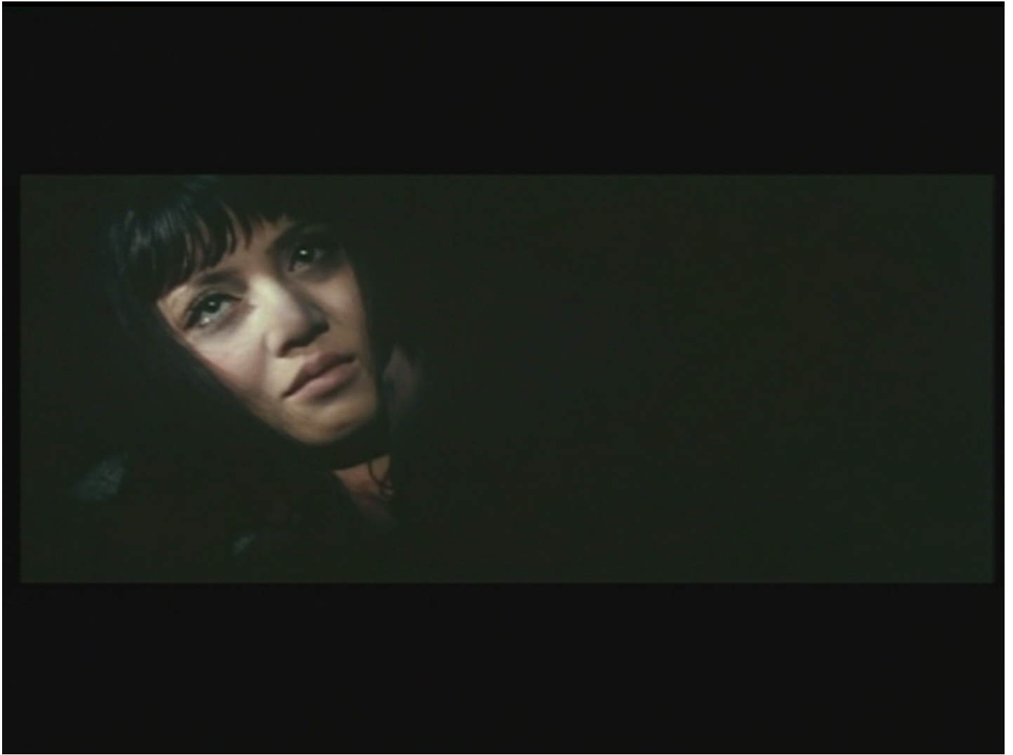
Masumura Yasuzō, La Bête aveugle , 1969, 35 mm, couleur, Daiei

L'image est néanmoins suspectée d'emblée en raison d'une voix post mortem douteuse. C'est que le visage ne peut être observé – il s'agit du plus long plan du film sur le visage de la jeune femme – qu'au prix, encore une fois, de sa visagification, c'est-à-dire qu'en cadavre, lequel l'effondre aussitôt pour le transformer en chose , et chose d'une ontologie bancale, une chose qui parle , « une chose qui pense ». Se joue alors ce que le film aura peut-être proposé de plus pervers : se clore en allant au bout de ce que la visagification du visage désimage dans l'image, de ce qui dans cette parole connecte le visage sur le sonore plus que sur la lumière, en ouvrant la piste à une visagité singulière : le visage comme étant moins à voir qu'à voix . Le visage, c'est ce qui commence par s'entendre. Entendons-nous sur le visage : cela n'est possible que lorsque le film s'épuise, se clôt, car le visage à voir est un vidage, une vidange. Et c'est