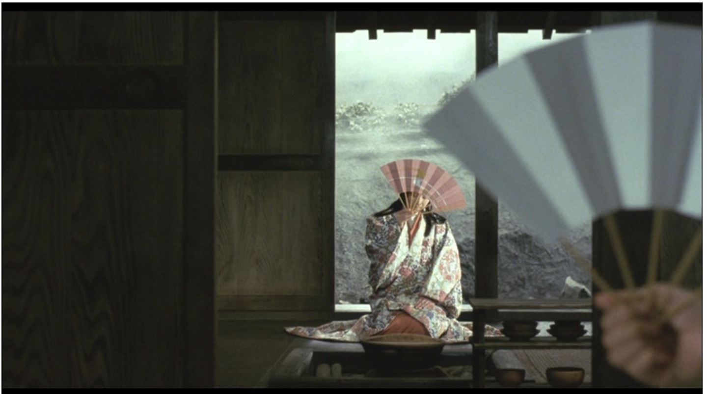
Yoshida Kijū, Hauts de Hurlevent , 1988, 35mm, couleur, Tōhō