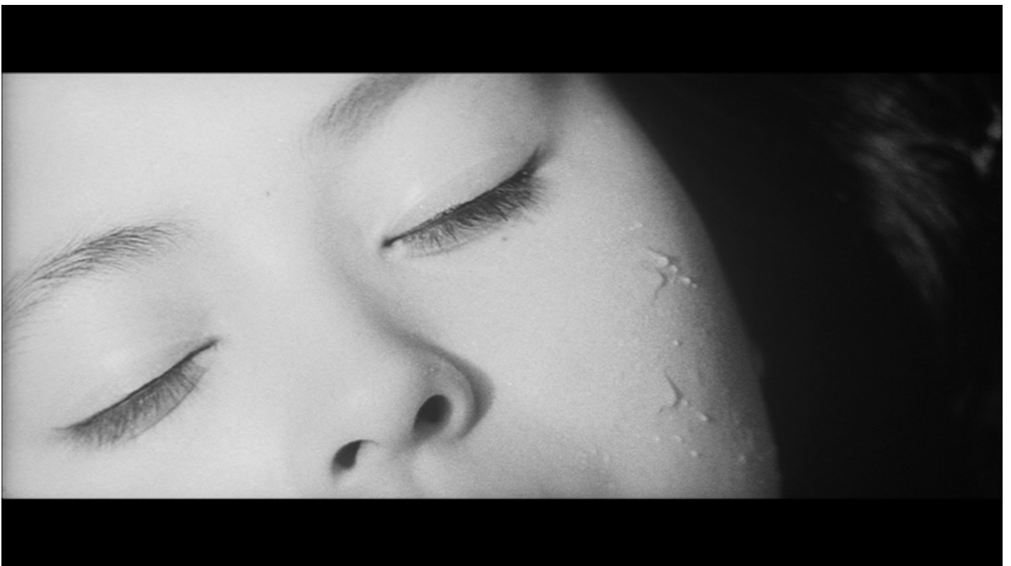
Ōshima Nagisa, L'Obsédé en plein jour , 1966, 35 mm, noir et blanc, Sozosha