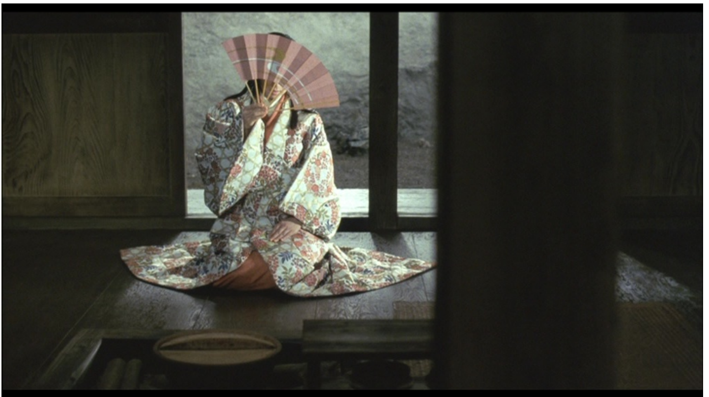
Yoshida Kijū, Hauts de Hurlevent , 1988, 35mm, couleur, Tōhō