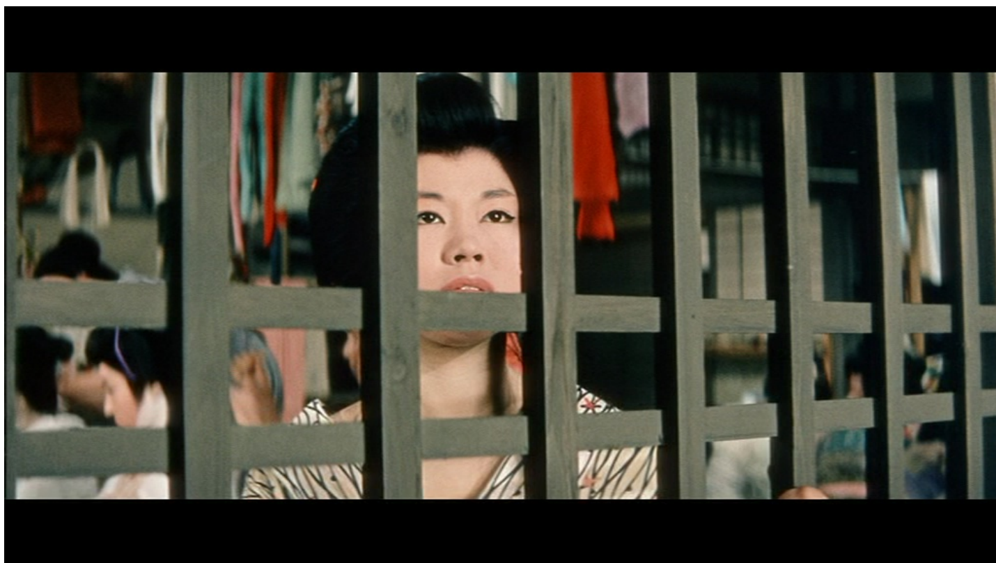
Uchida Tomu, Meutre à Yoshiwara , 1960, 35 mm, couleur, Toei

Dans le quartier des plaisirs d'Edo (ancien nom de Tōkyō), pendant la période Tokugawa, un riche artisan défiguré (Jirozaemon) cherche épouse et se fait berné par une prostituée de seconde zone devenue servante (Yaé) qui, en échange d'une affection feinte, lui extorque tout son argent pour devenir première geisha... Ce film – malgré sa date de réalisation – est à bien des égards encore parfaitement classique du point de vue de ses formes visuelles dominantes. Je me réfère ici à une poignée de plans où le visage de Yaé est photographié derrière les quadrillages en bois des fenêtres de l' okiya qui l'emploie comme domestique.