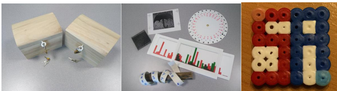
Figure 2 : matériel pour des activités liées à la représentation des données

Les activités autour des codes secrets et plus particulièrement de la cryptographie (Alayrangues et al.) permettent d'aborder la notion du codage (et en l'occurrence même de chiffrement) d'informations. Elles peuvent traiter de cryptographie symétrique, où la clé de chiffrement et la même que celle de déchiffrement (chiffre de César, scytale) ou de cryptographie asymétrique, où les clés de chiffrement et déchiffrement sont différentes (activité du coffre et des cadenas). Un autre terrain de jeu intéressant est le codage des images (IREM Clermont-Ferrand). On peut s'intéresser aux images binaires, autrement dit en noir et blanc, par exemple via un tableau de 0 et de 1. On peut également se poser la question de la compression de telles images, autrement dit de trouver un codage moins gourmand en mémoire. On peut aussi étendre l'activité à la représentation des images en couleur. Enfin, il est possible de réaliser des activités autour de la stéganographie (Alayrangues et al.), qui consiste à dissimuler une information dans une autre information. Une telle activité peut, par exemple, consister à cacher des chiffres ou des lettres dans une « image » réalisée avec des perles à repasser.