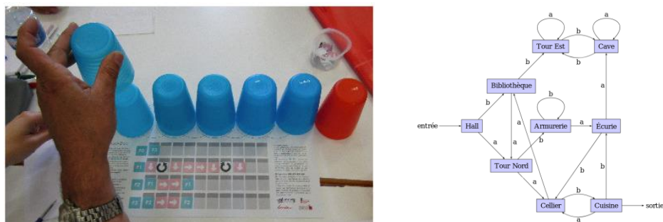
Figure 4 : matériel pour des activités liées aux langages

Les activités débranchées illustrant la notion de langage sont très souvent liées aux activités algorithmiques. Dans l'activité du robot-idiot (Duflot-Kremer), on peut notamment réfléchir à la manière d'exprimer les instructions qui permettront de diriger le robot pour atteindre le but fixé. L'activité Gobot (IREM Clermont-Ferrand) met à disposition un langage simplifié dont les instructions sont exprimées par des cartes représentant des flèches. Enfin, il est aussi possible de s'intéresser à la manière dont un langage peut être reconnu par un ordinateur, autrement dit, étant donné un mot, comment savoir s'il appartient ou non à un langage donné. Il s'agit d'aborder la notion d'automate, ce que propose notamment l'activité « jeu du labyrinthe » (IREM Clermont-Ferrand).