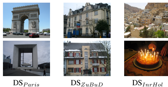
FIGURE 2 – Exemples des images des trois base d'images.

Les évaluations sont effectuées sur trois bases d'images publiques. Deux d'entre eux, la base de Paris ( DS_{Paris} ) [35] et la base des immeubles de Zurich ( DS_{ZuBuD} ) [36], sont des paysages urbains - donc des contenus plutôt structurés - alors que la base INRIA-Holidays ( DS_{InrHol} ) [37] est très variée et beaucoup moins structurée. La figure 2 montre quelques exemples des trois bases et le tableau 1 résume leurs principales caractéristiques.