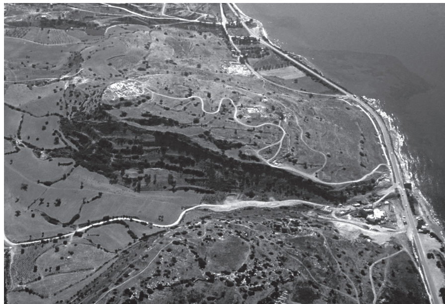
Fig. 1 – Vue aérienne du site d'Amathonte depuis l'ouest.

Les nombreuses équipes françaises et chypriotes qui ont opéré à Amathonte ont produit une grande quantité d'archives scientifiques, conservées, pour la partie française, au siège de l'EFA à Athènes. Il s'agit de documents de nature très diverse : carnets de fouille, photographies, dessins, plans, fiches papier, bases de données numériques, documents administratifs, rapports... Il en va de même, bien sûr, pour la partie chypriote, dont les archives se trouvent au département des Antiquités, au musée de Chypre de Nicosie et au musée de Limassol. La poursuite des activités à Amathonte implique l'accroissement