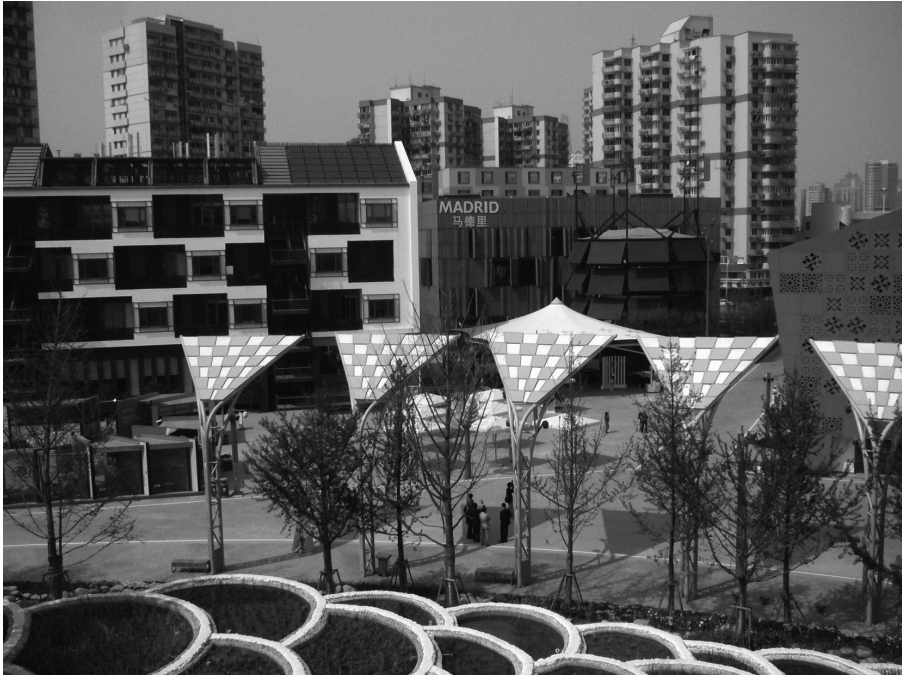
Photo 2 : Le pavillon de Shanghai (à gauche), ses murs en partie végétalisés et sa toiture photovoltaïque