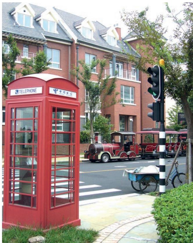
Photo 2 – Un cliché à l'anglaise en banlieue de Shanghai en août 2007.

Pour l'arrondissement de Songjiang et la société de développement de la ville nouvelle, Thames Town est un projet-vitrine visant à stimuler l'intérêt des promoteurs immobiliers et des particuliers, donc à maximiser la hausse de la valeur foncière lors de la cession des droits d'usage, ce qui correspond