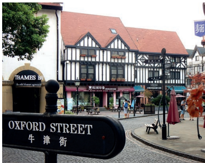
Photo 1 – Le centre « ancien » de Thames Town en août 2016.

Contrairement aux autres opérations du secteur à l'anglaise de Songjiang, comme British Manor, Red Villa, Shanghai Townhouse ou Rose Bush, lesquels présentent une homogénéité de leur bâti, le souci du détail est très poussé à Thames Town. La juxtaposition d'habitations relevant d'époques, de styles architecturaux, de compositions des volumes (fenêtre en saillie), de techniques de construction et de matériaux divers (colombages, briques rouges et grises, crépis) tend à faire naître une impression d'éclectisme. L'espace public de Thames Town se décline suivant trois ambiances : le cœur historique autour de l'église néo-gothique et de Love Square renvoie à un ensemble classique, géorgien et victorien ; Holiday Square, ceinturé de bâtiments en briques rouges et grises, symbolise la révolution industrielle