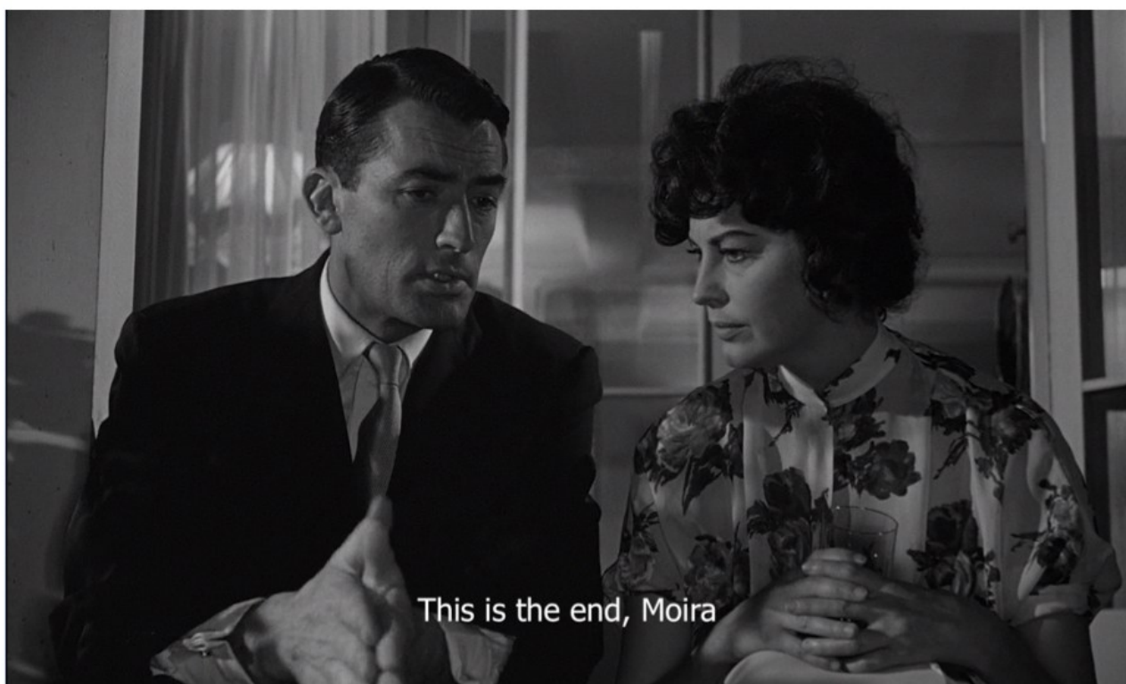
Ava Gardner et Gregory Peck dans Le Dernier Rivage

D ans Situation de l'écrivain en 1947 , l'expérience-limite de la torture comme situation extrême révèle l'humanité de l'homme comme « fin en soi ». Pour Sartre, il revient à tout homme de faire advenir cette humanité – c'est-à-dire de se faire homme –, au mépris de ses intérêts en tant qu'être vivant – c'est-à-dire au prix de sa vie. Poser en soi-même l'humanité comme fin en soi, c'est poser tout homme comme fin en soi. Cette exigence d'universalisation de l'expérience singulière de la condition humaine justifie