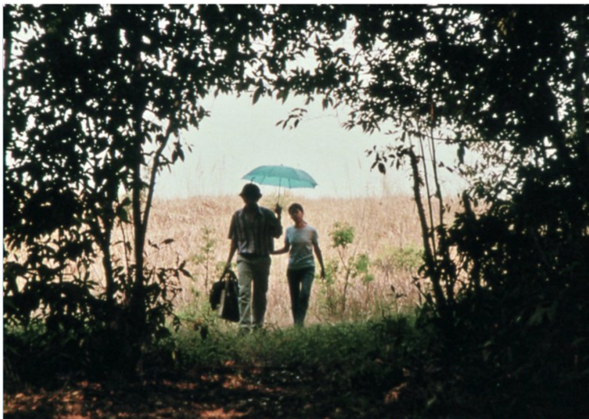
Apichatpong Weerasethakul, Blissfully Yours

Il est inutile de dire qu'une telle définition ne doit absolument pas être lue comme une déclaration politique proclamant le droit universel à la vie. Nous avons quitté le terrain de Sartre et les murs de sa Cité. Le Règne des fins de Kant, « (qui n'est à la vérité qu'un idéal) » ( Fondements de la Métaphysique des mœurs , p. 148), est un modèle formel de Monde moral conçu à l'usage d'une métaphysique des mœurs. Le Règne des fins présenté ci-dessus dans sa version révisée se propose comme modèle formel des multiples Mondes fictionnels auxquels pourrait donner lieu une nouvelle morale littéraire. On remarque à quel point cette Méta-poétique convient à la définition de la nouvelle littérature comme « écologie du récit ».