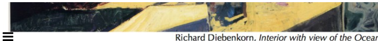
Richard Diebenkorn, Interior with view of the Ocean