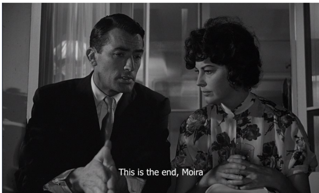
Ava Gardner et Gregory Peck dans Le Dernier Rivage

D ans Situation de l'écrivain en 1947 , l'expérience-limite de la torture comme situation extrême révèle l'humanité de l'homme comme « fin en soi ». Pour Sartre, il revient à tout homme de faire advenir cette humanité – c'est-à-dire de se faire homme –, au mépris de ses intérêts en tant qu'être vivant – c'est-à-dire au prix de sa vie. Poser en soi-même l'humanité comme fin en soi, c'est poser tout homme comme fin en soi. Cette exigence d'universalisation de l'expérience singulière de la condition humaine justifie